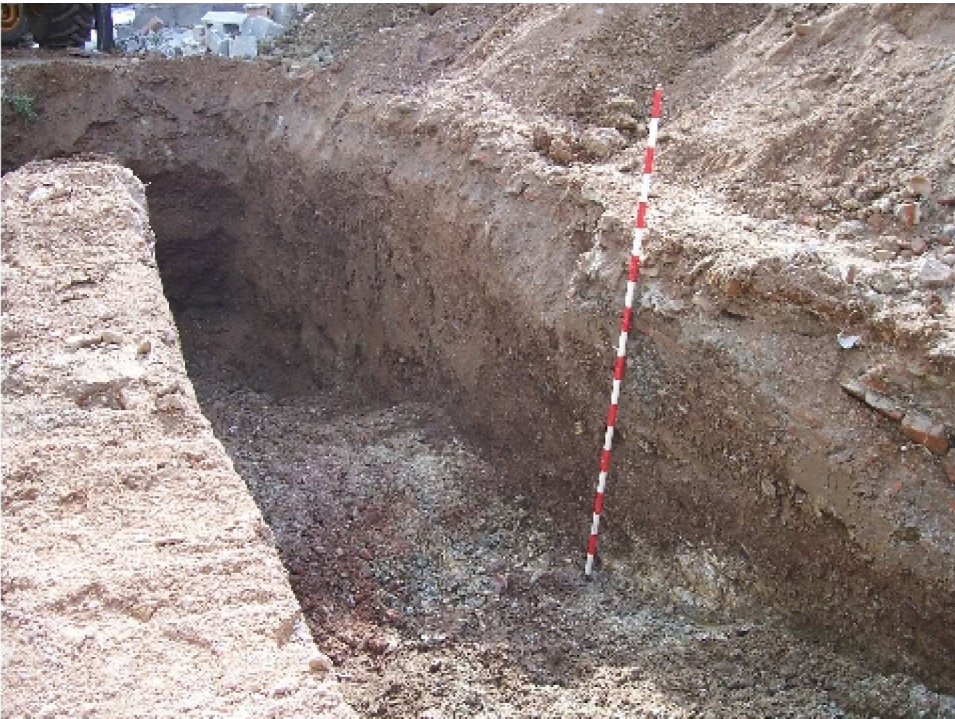
Lámina VI. Vista del perfil Oeste.