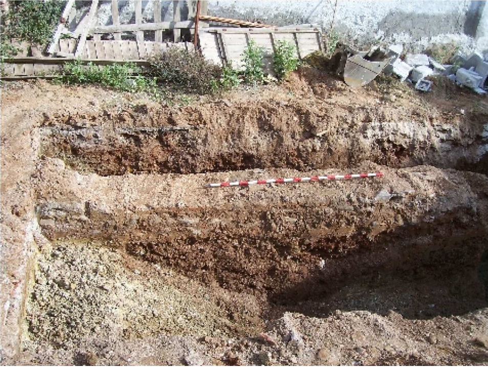
Lámina V. Detalle de la estructura muraria UEC 1.