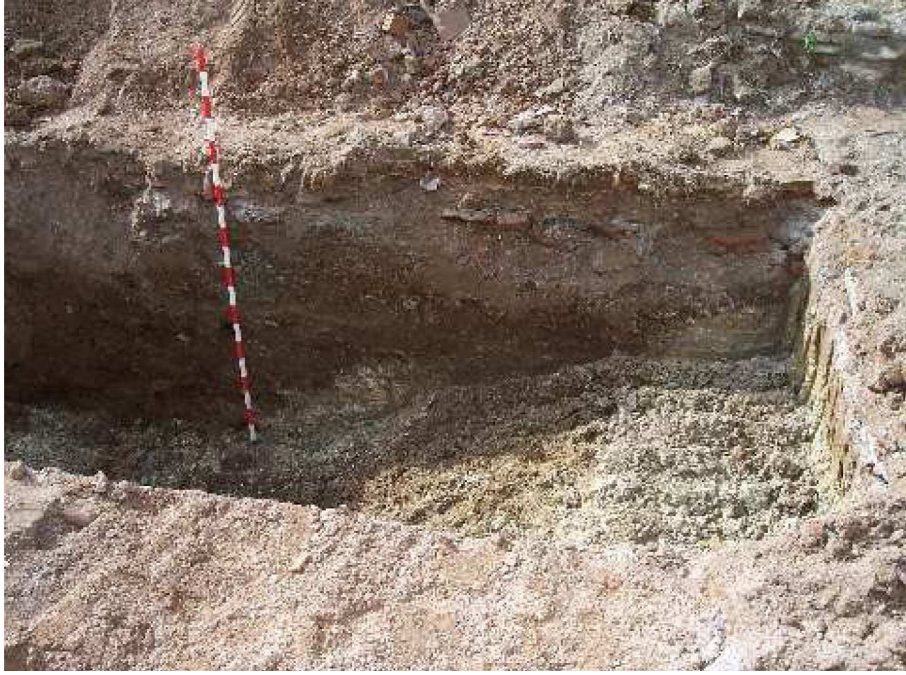
Lámina VII. Detalle Perfil Oeste.