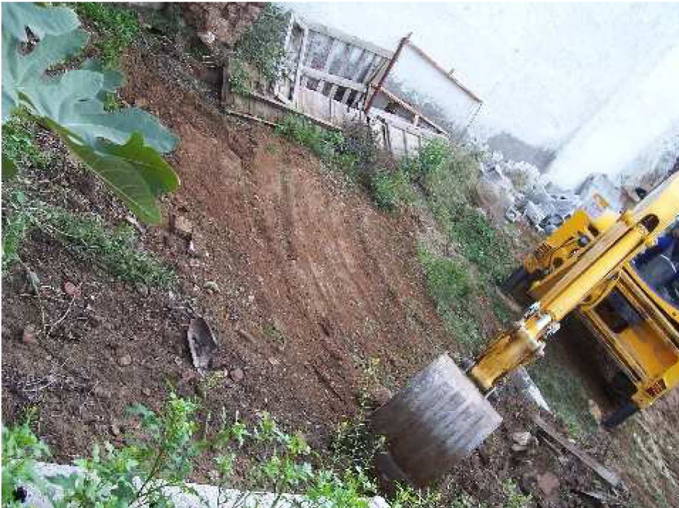
Lámina II. Situación de la parcela antes de comenzar la intervención.