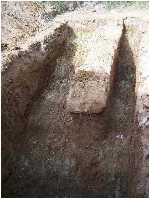
Lámina IX. Detalle de la estructura muraria UEC 1, y de la antigua ladera.