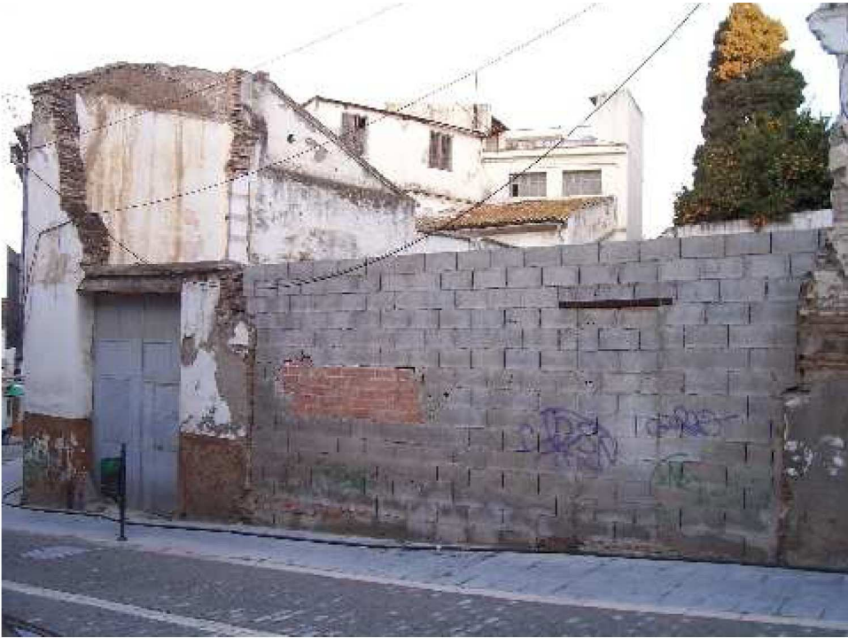
Lámina I. Fachada del inmueble antes de la vigilancia.