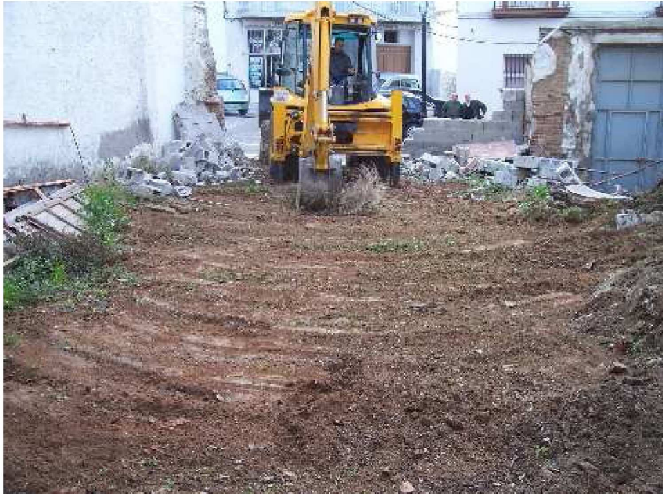
Lámina III. Limpieza de la vegetación de la parcela antes de la intervención.