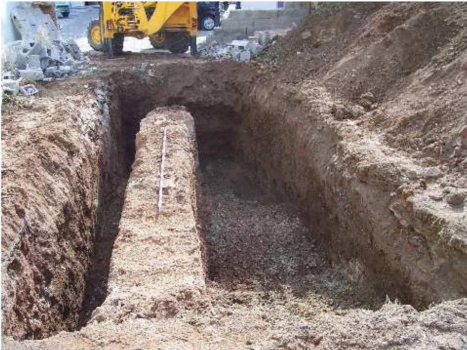
Lámina IV. Vista general de la estructura muraria UEC 1.