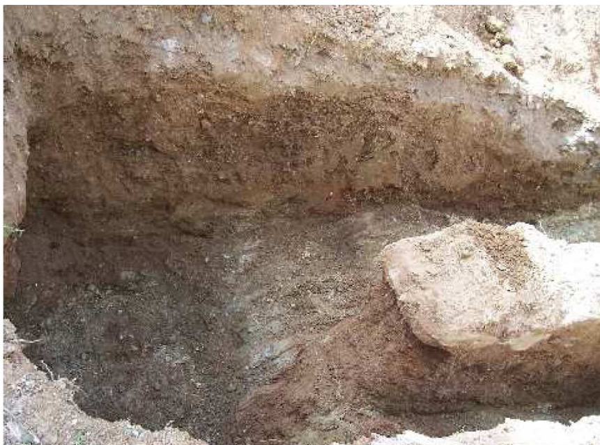
Lámina X. Detalle del sector sur de la cata.