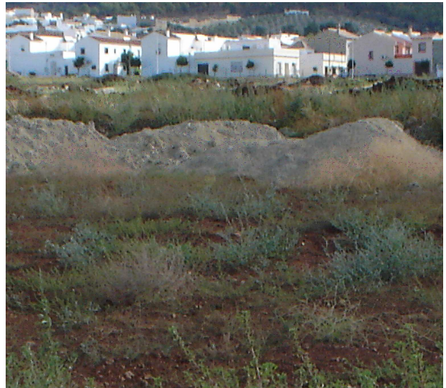
Lám. II. Vista parcial del sector, escombreras