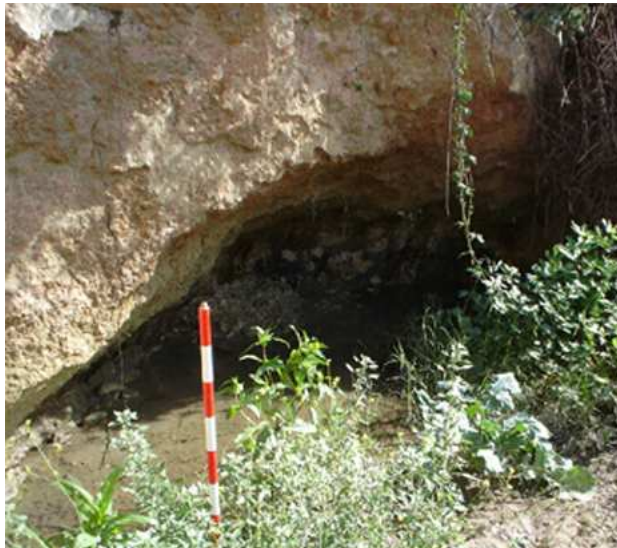
Lám. I. Concavidad natural labrada en el sustrato