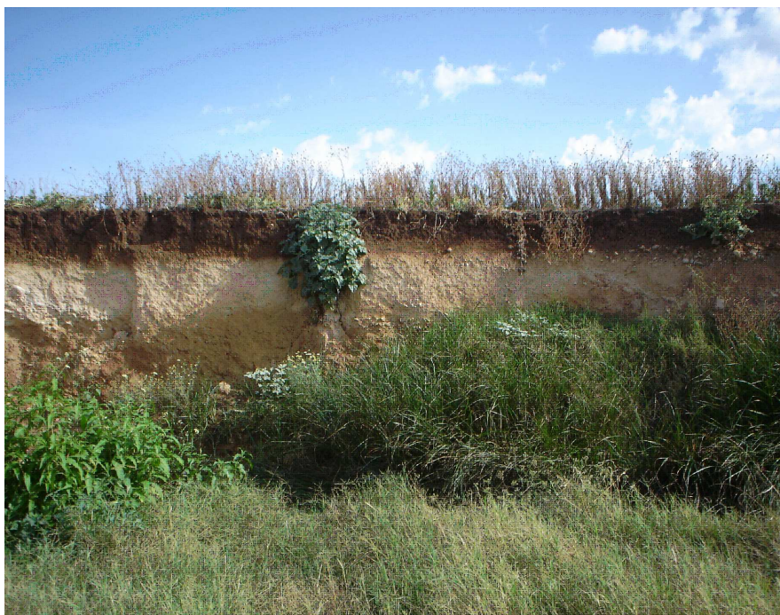
Lám. III. Perfil del sector desde el sureste, coincidiendo con el tajo del arroyo

En conclusión, podemos decir que el Sector denominado "Los Llanos de Morejón" tras la prospección realizada y el análisis de los resultados de la misma, no aparecen indicios en superficie de posibles estructuras subyacentes que nos lleven a pensar en la localización de algún yacimiento con entidad arqueológica.