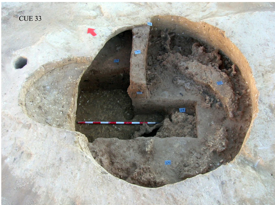
Lám 1.- CUE 33 DETALLE DE UNIDADES

Estas cabañas carecen de zócalo pétreo, y se presentan con una estructura vegetal flexible, formada por postes de diverso grosor entrelazados y recubiertos por adobe fresco o barro que asegure un aceptable nivel de aislamiento. Cabe destacar la presencia constante en todas las estructuras habitacionales de pellas y concentraciones de adobe, conformando un derrumbe que parece avalar la existencia de tales recubrimientos. Las improntas vegetales en adobe fresco o cocido son también muy frecuentes, siendo la estructura más destacada la número 32 con una cantidad masiva de todo tipo de improntas vegetales conservadas en adobe termoalterado. De ellos se realiza actualmente un estudio pormenorizado aun no concluido, cuyo objetivo es la reconstrucción de las técnicas constructivas.