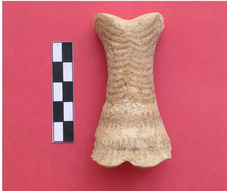
Lám. 2.- ÍDOLO