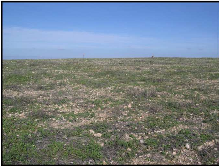
Lámina II. Vista de la zona Sur. Terreno pedregoso sin arar (Sector A).