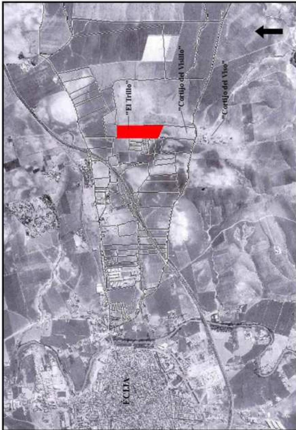
Figura 2. Localización general de Écija, del área "El Trillo", del "Cortijo del Visillo" y del "Cortijo del Viso", Écija (Sevilla). Foto aérea S/E.

La parcela conformaba un espacio de tendencia rectangular, con eje longitudinal Norte-Sur, que incluía las parcelas 171 y 172 del polígono catastral 29, con una superficie total de 9.9 hectáreas ( Figura 2 ).