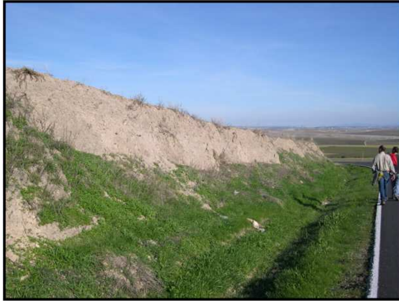
Lámina VI: Perfil, fuera del área de estudio, donde se documentó TSCA/D y TSCD.