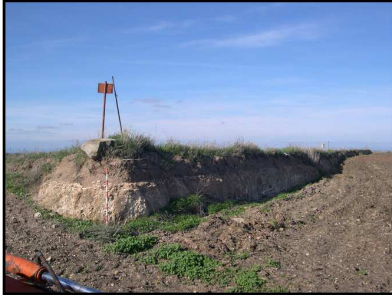
Lámina III. Vista del Sector B "perfil delimitador por el este".

La metodología seguida para la realización de la Prospección Arqueológica fue la prevista en el proyecto de intervención. Como primer paso metodológico se obtuvo la planimetría topográfica de todo el área de estudio, de forma que se pudiera realizar, en su caso de haber sido documentados, una localización exacta de los posibles restos arqueológicos. La utilización de la planimetría se complementó en campo con la utilización de GPS (modelo THALES Navigator Mobilemapper). En función de sus características físicas, el terreno prospectado se diferenció en dos sectores ( Figura 3 ): Sector A, correspondiendo a la superficie integra del área de prospección y el Sector B, que se refería a la sección del terreno de aproximadamente 1,40 m. de altura que recorría la práctica totalidad del límite Este del área estudiada ( Lámina III ).