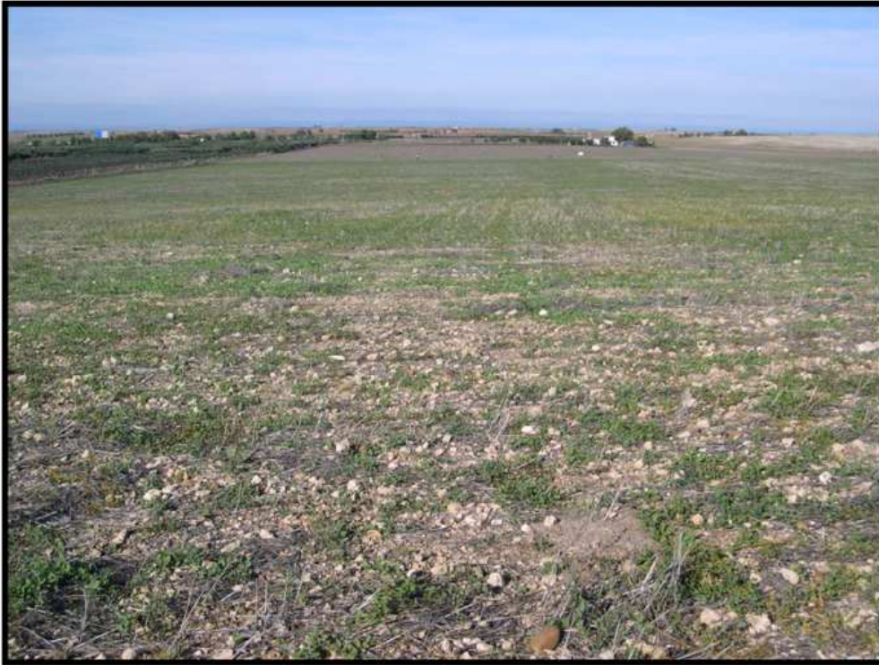
Lámina I. Vista general del área de prospección de Sur a Norte (Sector A).