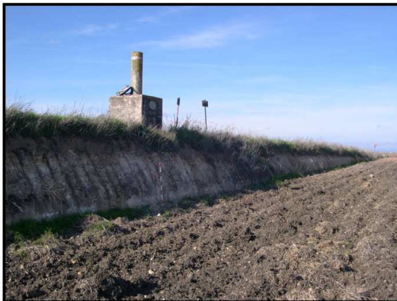
Lámina V: Vista del Sector B y del Vértice Geodésico.

Sector B: (Figura 3) El Sector B ocupa el perfil Este del área de prospección, funcionando como límite de la misma. La accesibilidad y la visibilidad para la revisión de este perfil eran muy buenas ( Lámina V ). Así, completada la prospección del Sector B, se comprobó que no existían en su ámbito restos de carácter arqueológico.