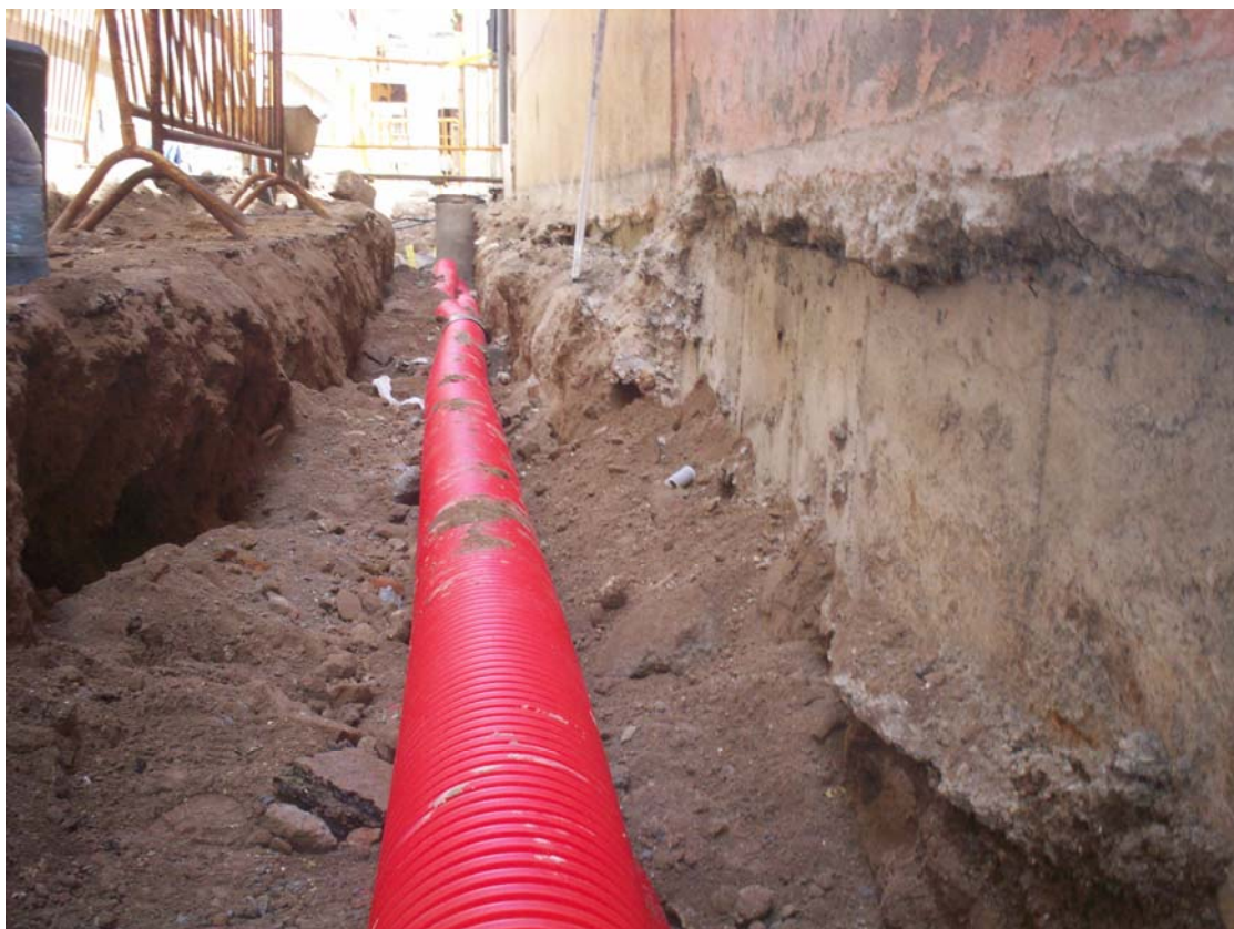
Lám. 1. Zanja y Saneamiento.