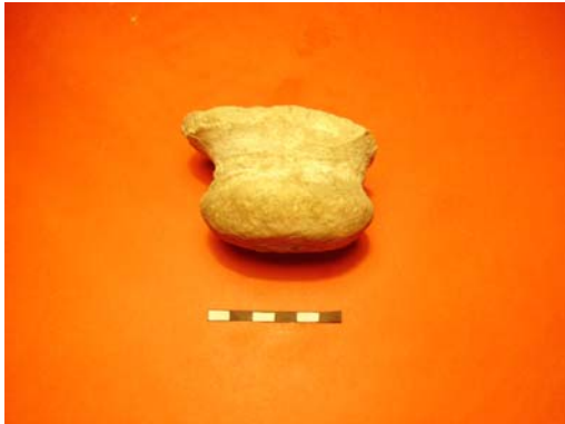
LÁMINA V (ánforas)