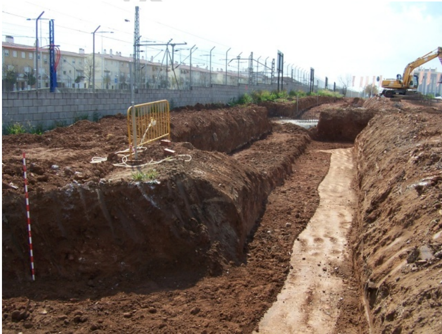
Lámina 6. Vista de la excavación para zona muro de seguridad (Sector B).