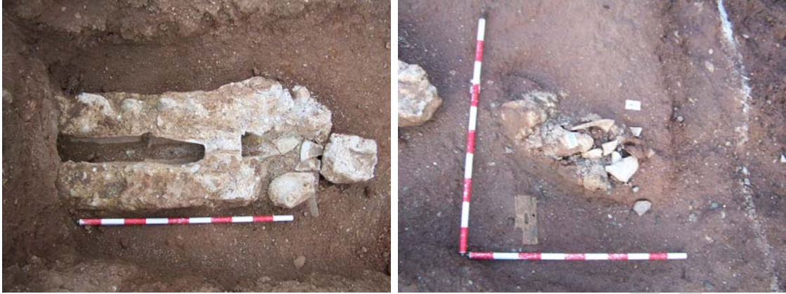
Lámina 9 a y b. Vista cenital y detalle del arrasamiento en el Sector A de la canalización moderna Uu.ee. 8, 5 y 5a).