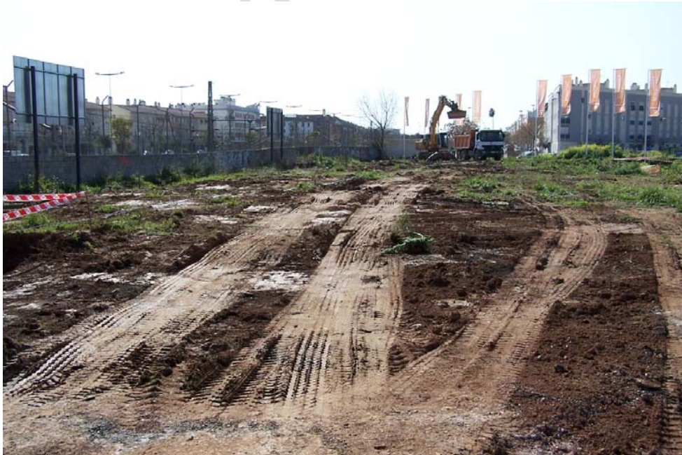
Lámina 2. Vista hacia el Oeste del entorno del solar previo a las obras.