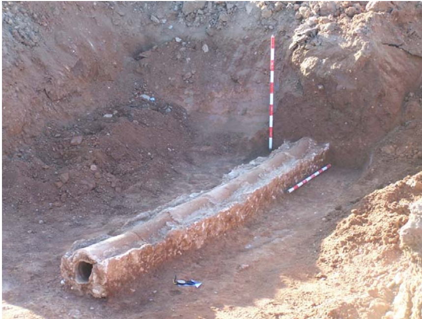
Lámina 8. Canalización Moderna afectada por las obras de urbanización en el Sector B.