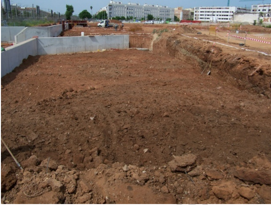
Lámina 7. Explanación para zona ajardinada (Sector B).