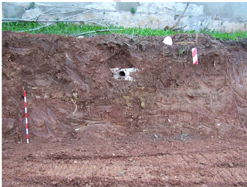
Lámina 4. Vista del perfil Norte (Uu.ee. 0, 1, 8a, 8b y 2 Sector A).