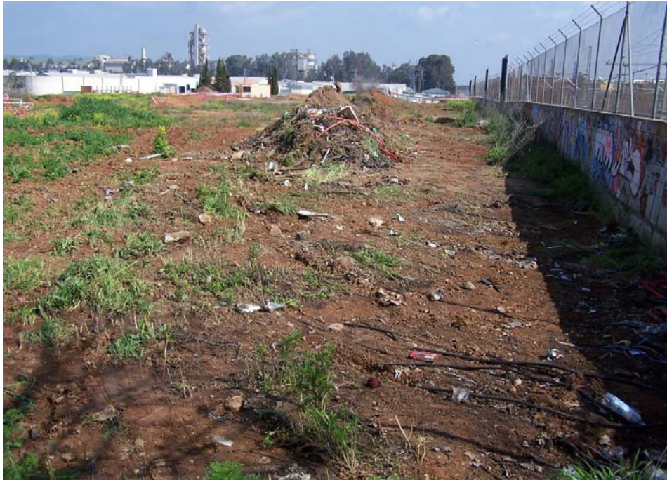
Lámina 1. Vista hacia el Este del entorno del solar previo a las obras.