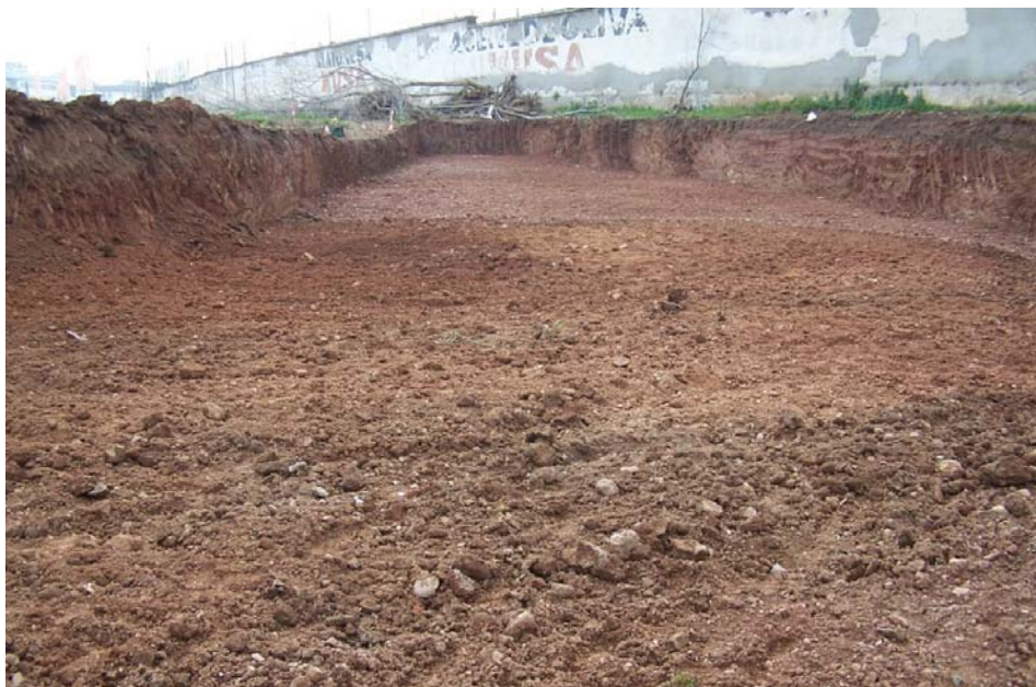
Lámina 3. Vista hacia el Noroeste del primer rebaje de excavación en el vial (Sector A).