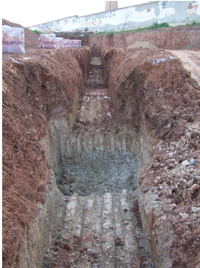
Lámina 5. Vista hacia el Noroeste de la zanja (Red de saneamiento- Sector A).