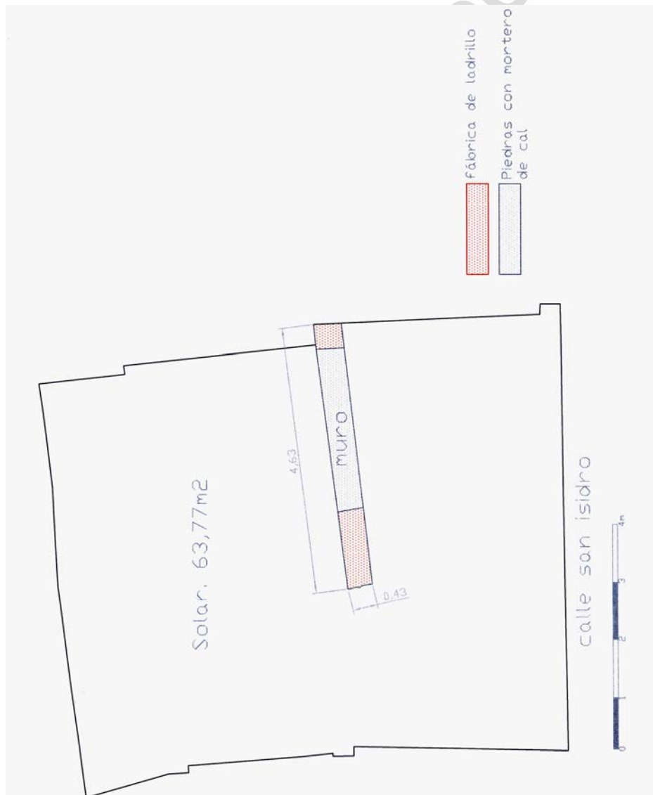
Planta general del solar con la estructura documentada.