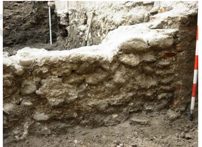
Alzado de la estructura. Se observa la fábrica de ladrillo en los extremos y la mampostería con tierra y cal en la parte central.