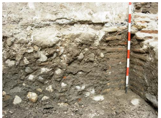
Muros de la cimentación perimetral.