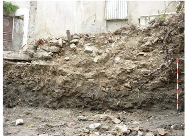
Tierras de relleno.