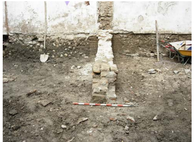
Distintas perspectivas de la estructura aparecida.