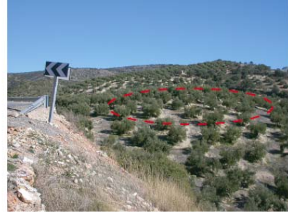
Vista General del yacimiento arqueológico (T.M. Castillo de Locubín). Tramo 1.

subsuelo, deben ser corregidas a través de la investigación científica.