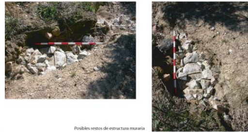
Posibles restos de estructura muraria