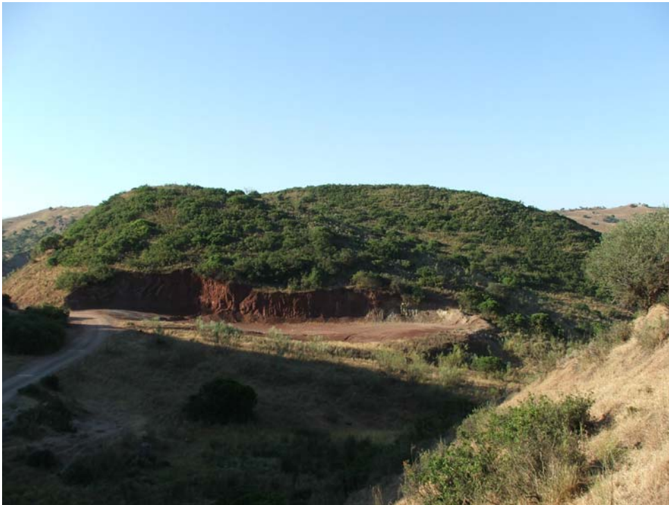
Lám. III- Panorámica general desde el Norte