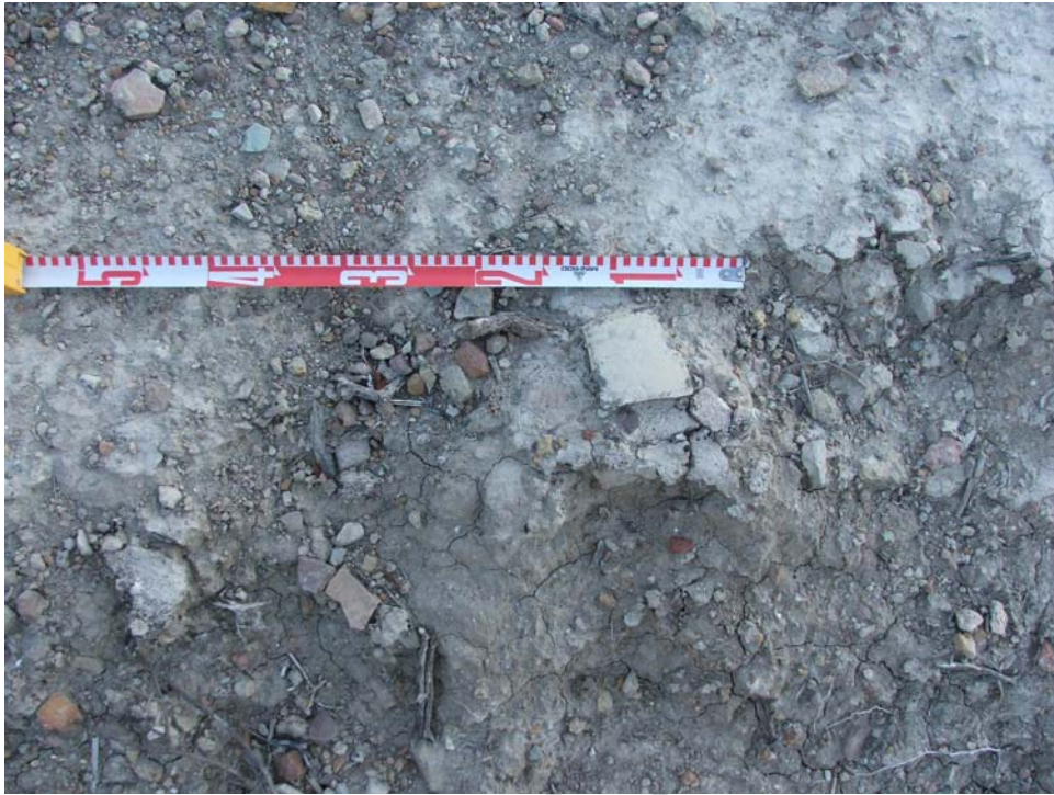
Lám. VII- Detalle de la cerámica en la ladera Sur (COTA 282,5 msnm)