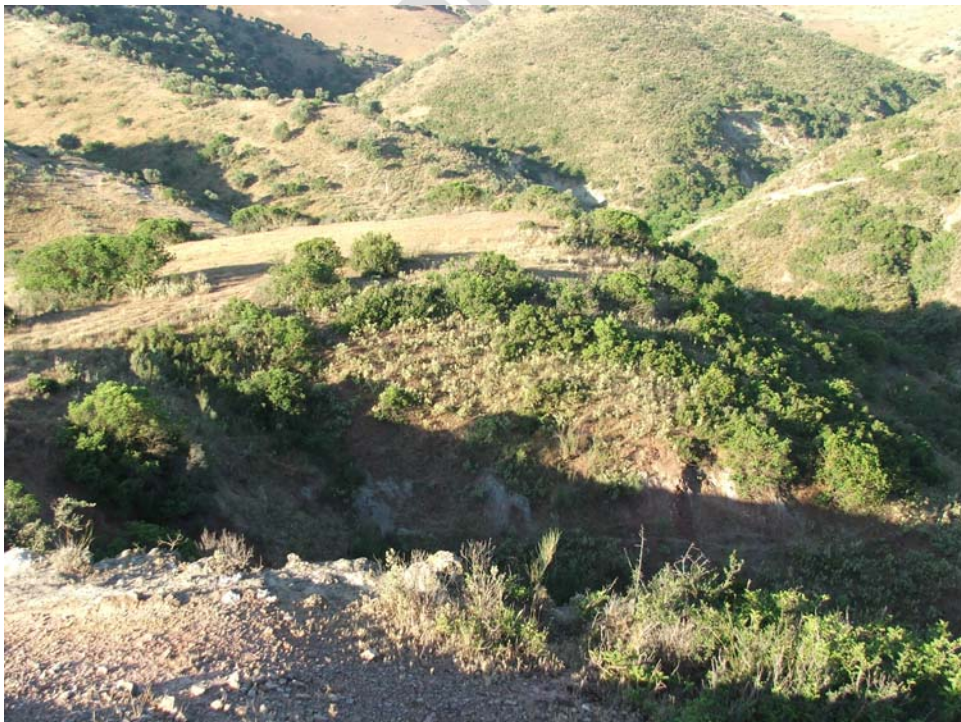
Lám. X- Panorámica general desde el Norte (COTA 257,5 msnm)