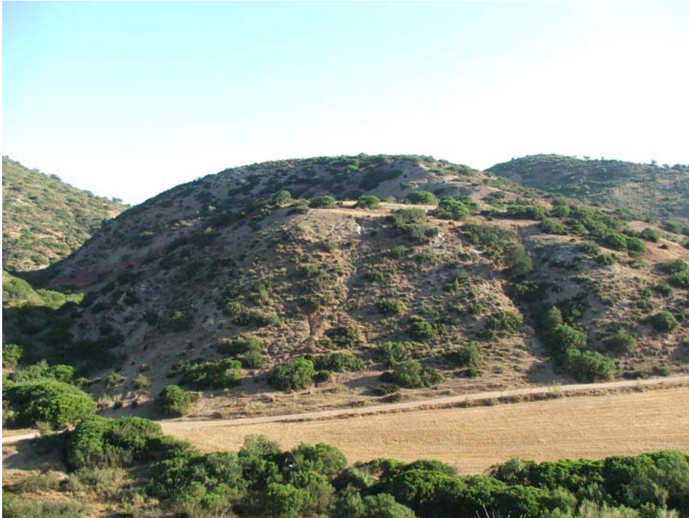
Lám. I- Panorámica general desde el Sur