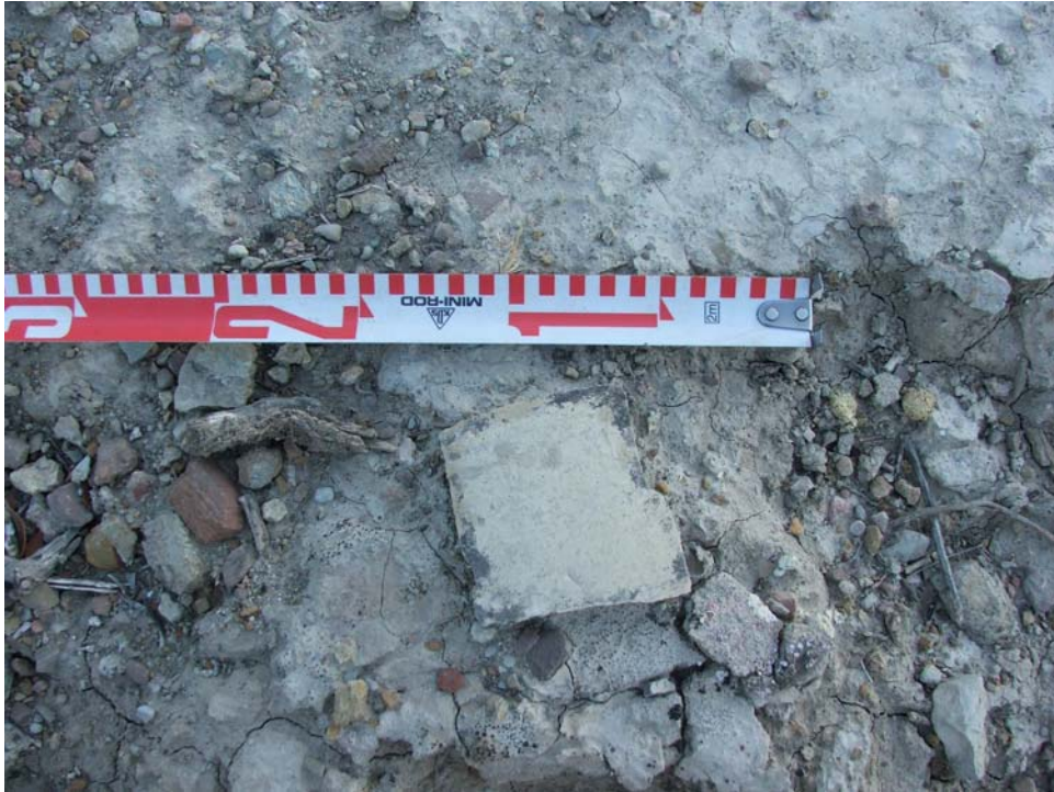
Lám. IX- Detalle de la cerámica en la ladera Sur (COTA 282,5 msnm)