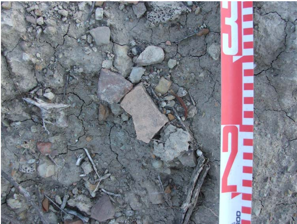
Lám. VIII- Detalle de la cerámica en la ladera Sur (COTA 282,5 msnm)