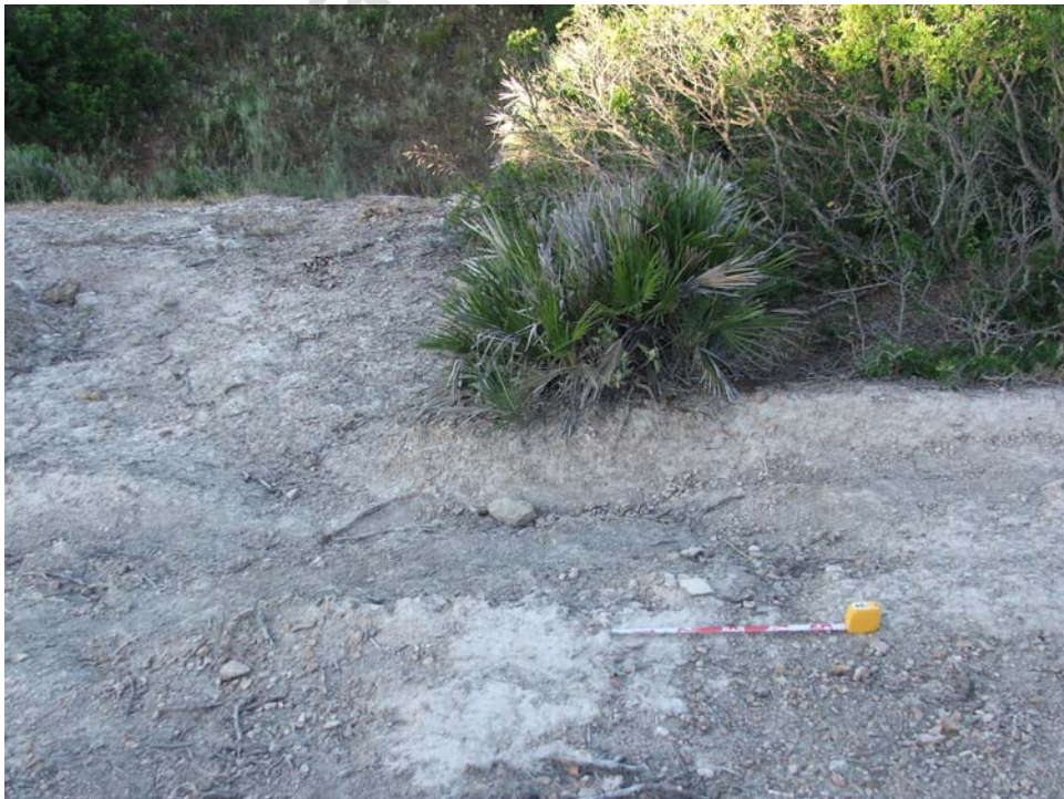
Lám. VI- Vista de contexto del área de dispersión cerámica (COTA 282,5 msnm)