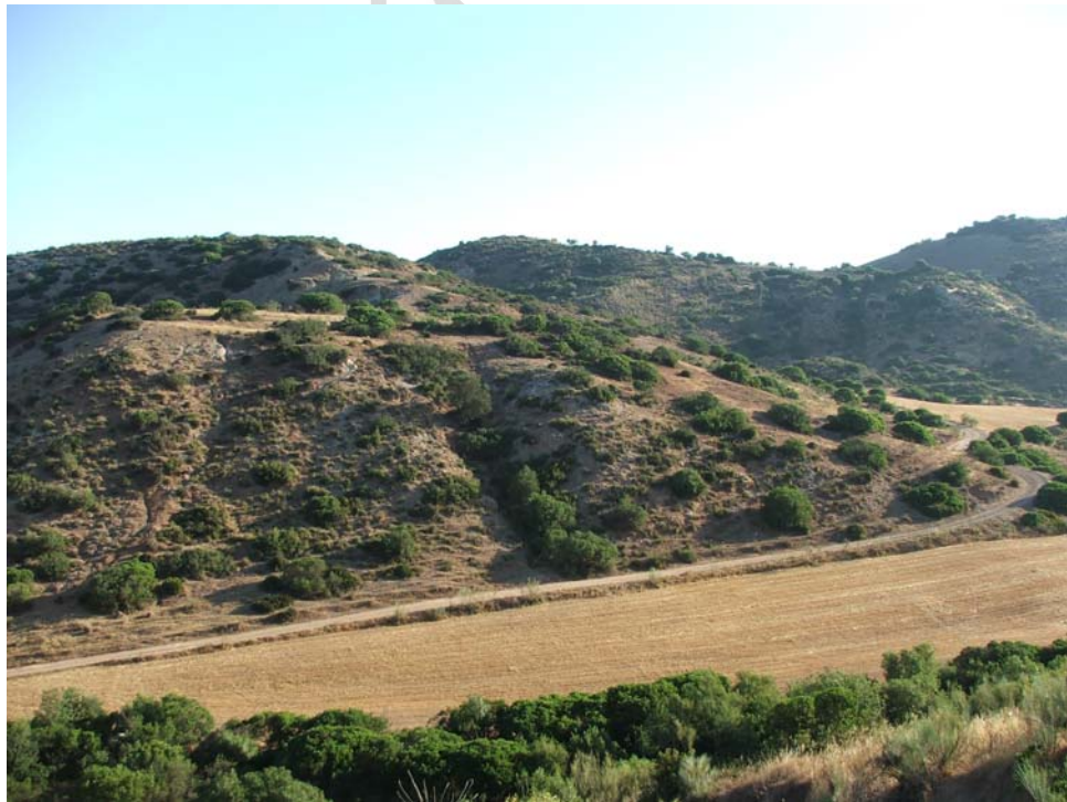
Lám. II- Panorámica general desde el Sureste