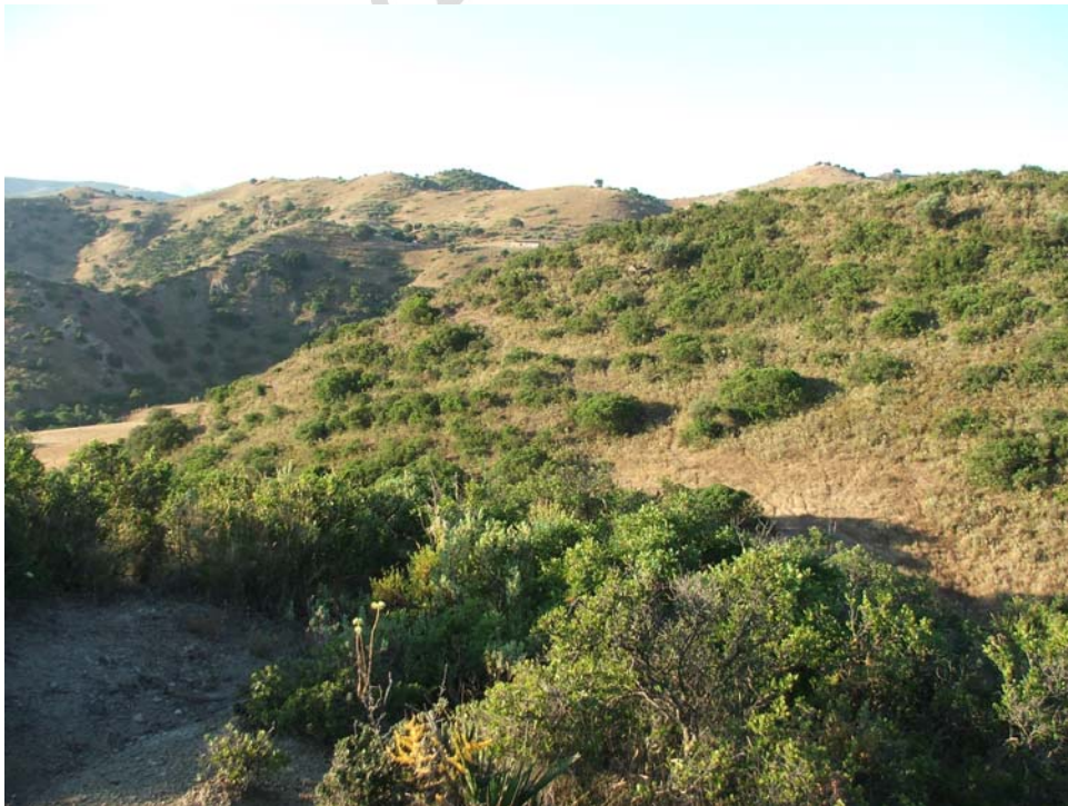
Lám. IV. Vista de la ladera Suroeste (COTA 282,5 msnm)