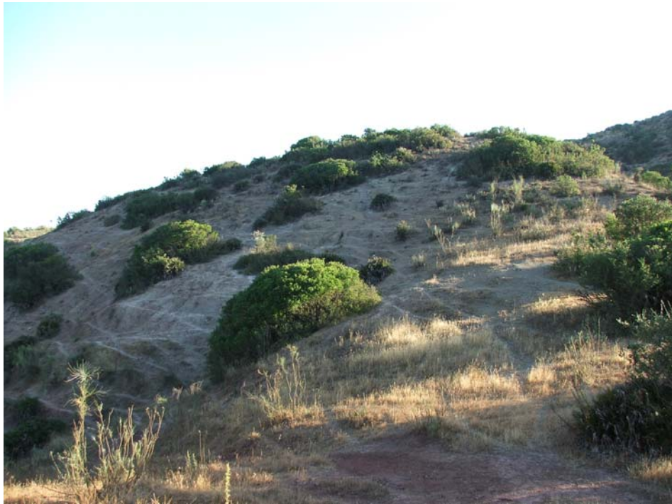
Lám. V- Vista de la ladera Sur, donde aparecen restos cerámicos (COTA 282,5 msnm)