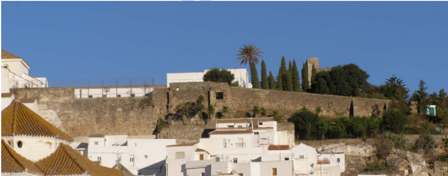
LAM I. Vista General de la zona a Intervenir.

El presente informe se redacta con objeto de efectuar la diagnosis de las estructuras defensivas de parte del recinto amurallado adscrito al Municipio de Alcalá de los Gazules. Este análisis estimará las medidas de consolidación más adecuadas que se deriven de estos reconocimientos.