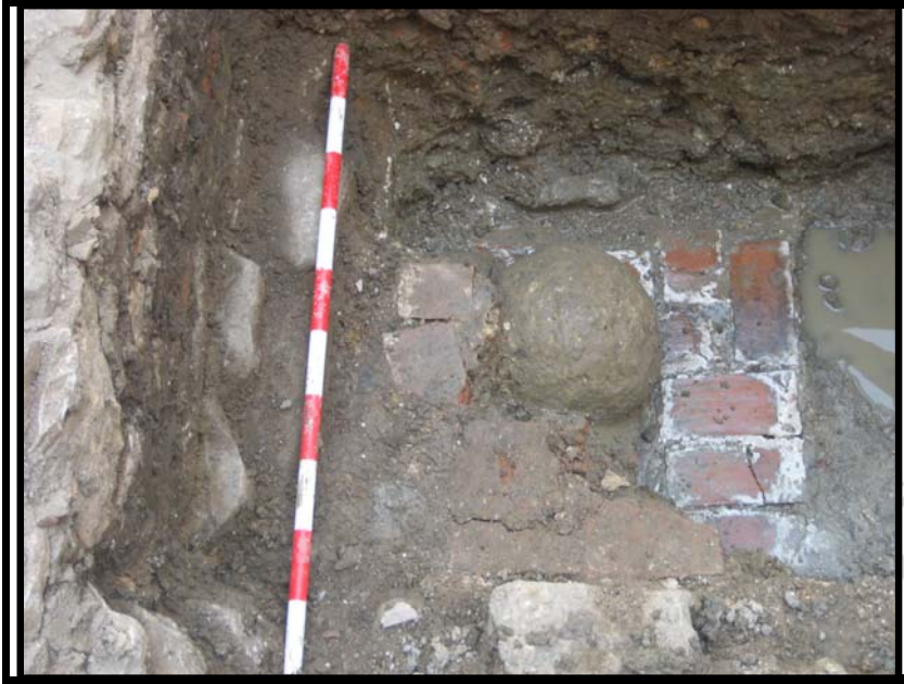
Foto 8. Bolaño en C-2 sobre la solería U.E.41