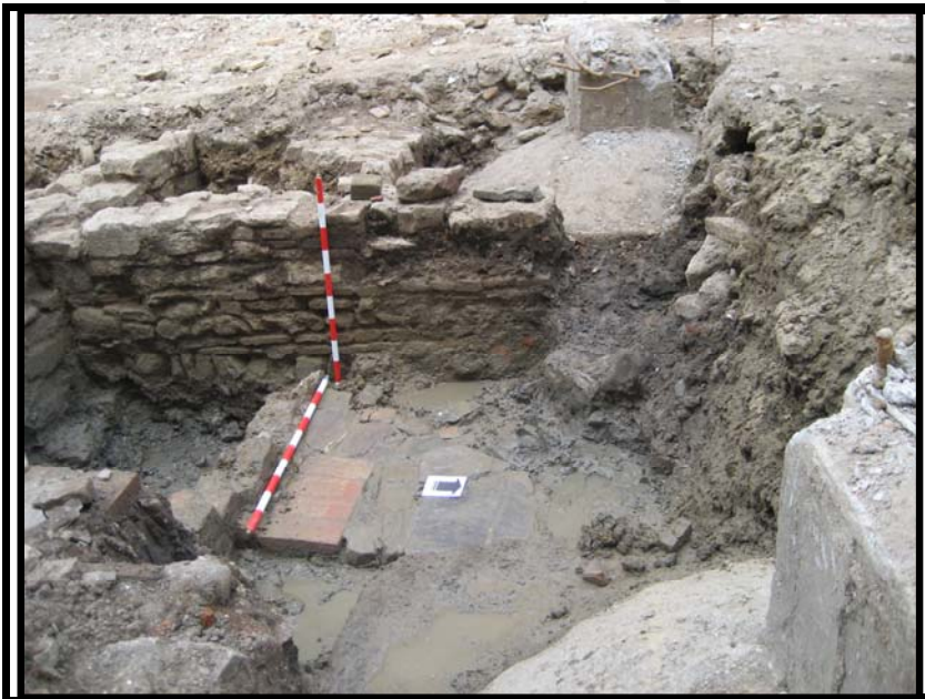
Foto 5. Suelo C-1 U.E.13 Una de las fases de solería asociada a la U.E.M.2.