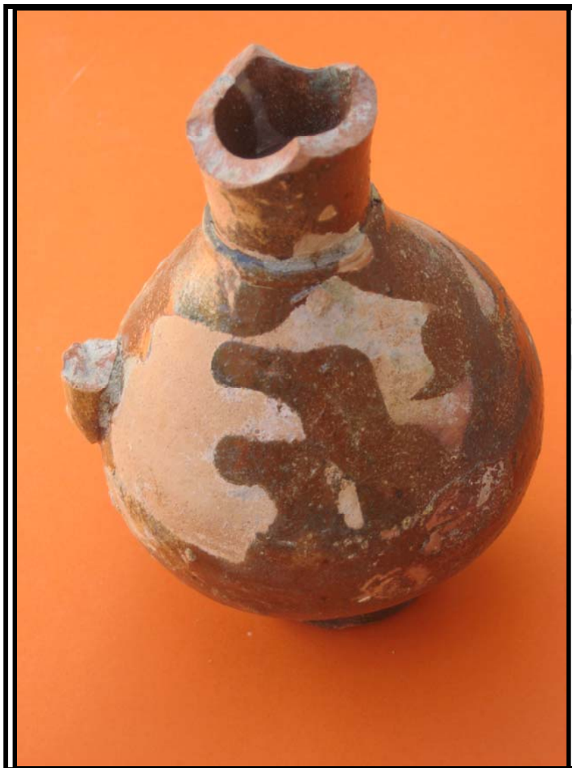
Figura 12. Jarrita melada. C-2 U.E.6