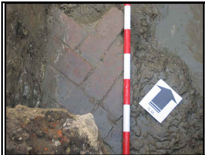
Foto 6. Suelo en espiga. C-1 U.E.17