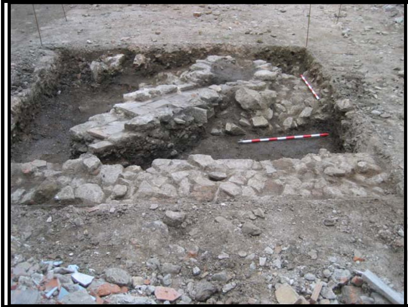
Foto 2. C-2 U.E.M.1 y U.E.2. Estructuras pertenecientes a la fase contemporánea (S. XIX)