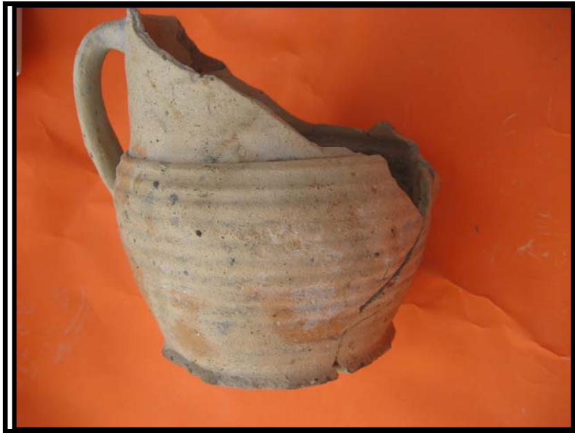
Figura 3. Jarra semi completa. C-2. U.E. 6