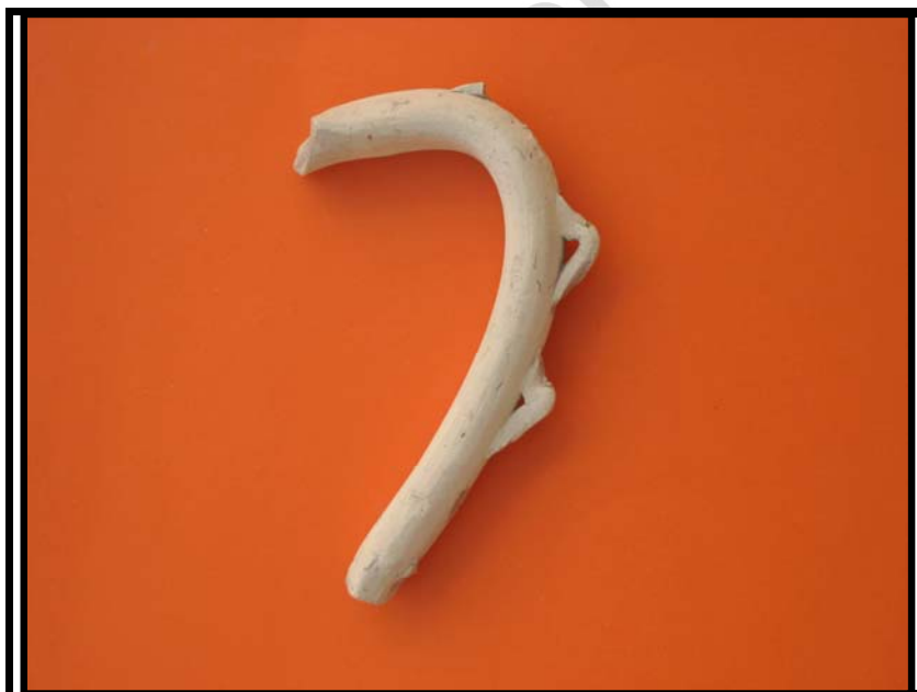
Figura 8. Asa con decoración. C-2 Sondeo-1 U.E.16