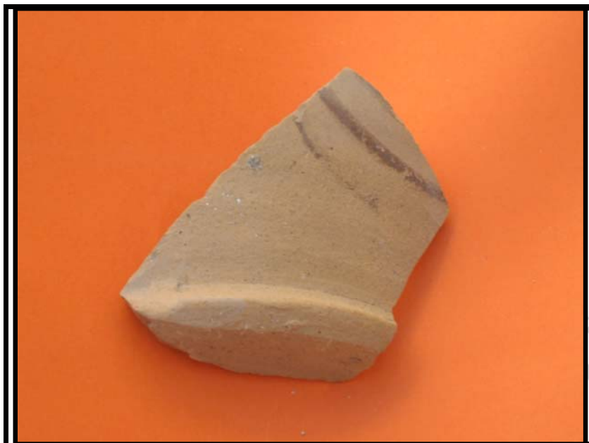
Figura 15. Fondo jarrita decorada. C-1 U.E.6