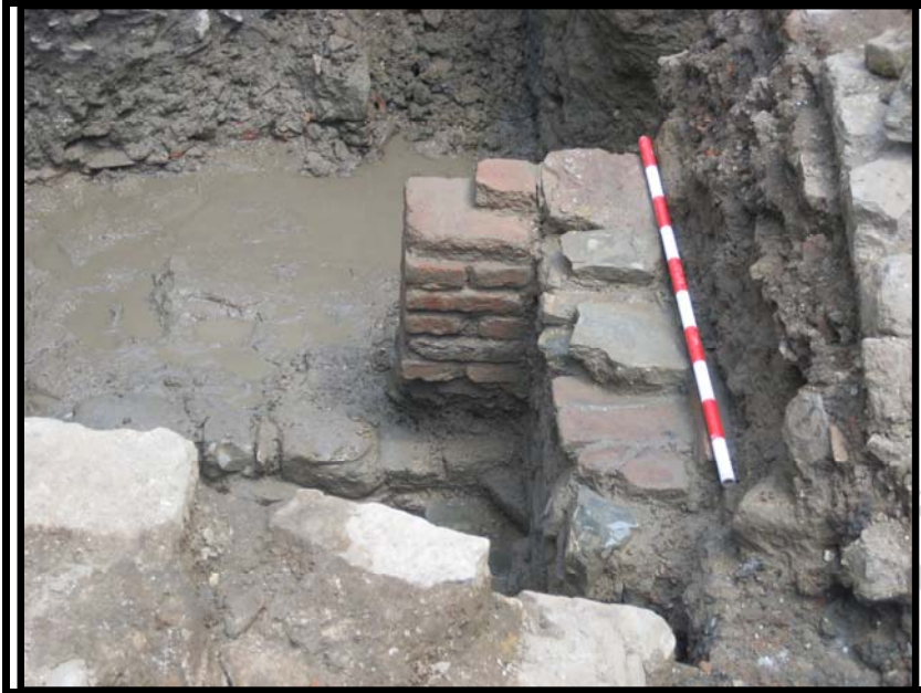
Foto 4. Estructura de habitación correspondiente a la segunda II fase de ocupación medieval.