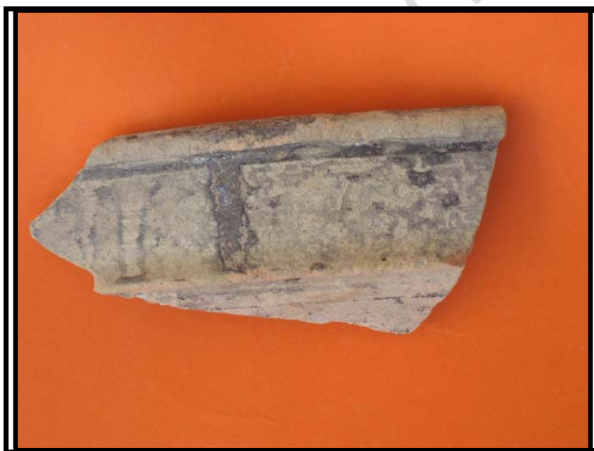
Figura 16. Borde atañido. C-2 sondeo-1 U.E.17