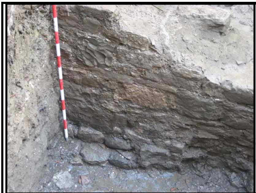
Foto 10. Estructura muraria U.E.60 perteneciente a la I fase medieval.