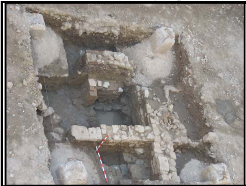
Foto 3. Estructuras contemporáneas afectando a muros medievales.