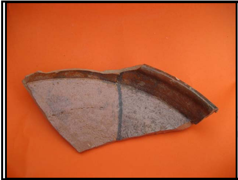
Figura 5. Borde ataifor. C-3 Sondeo 4 U.E.30