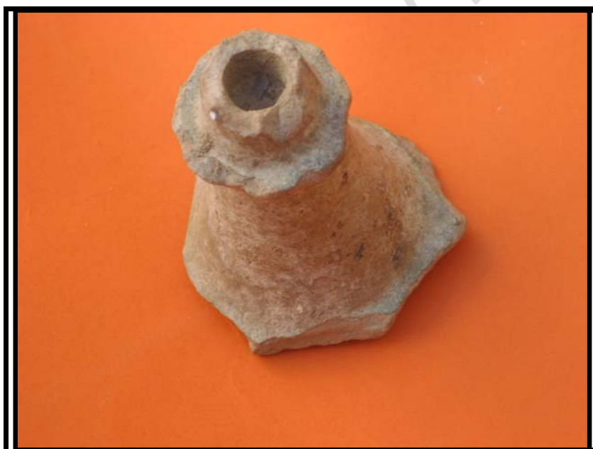
Figura 14. Fragmento candil. Ampliación E. U.E.42