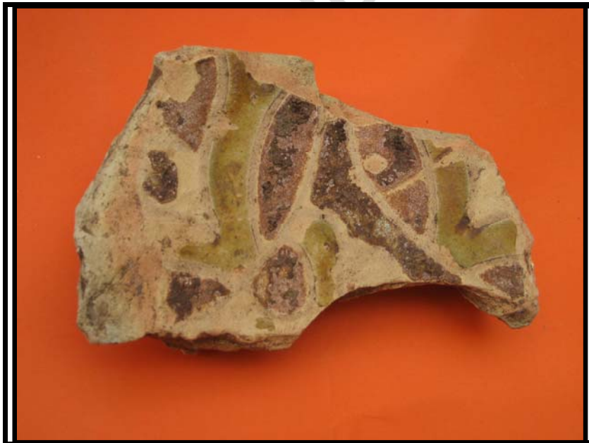
Figura 6. Fondo ataifor. C-3 U.E.0