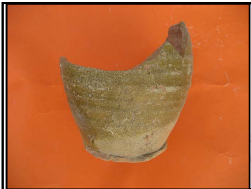
Figura 7. Jarrita vidriada. C-2 U.E.6