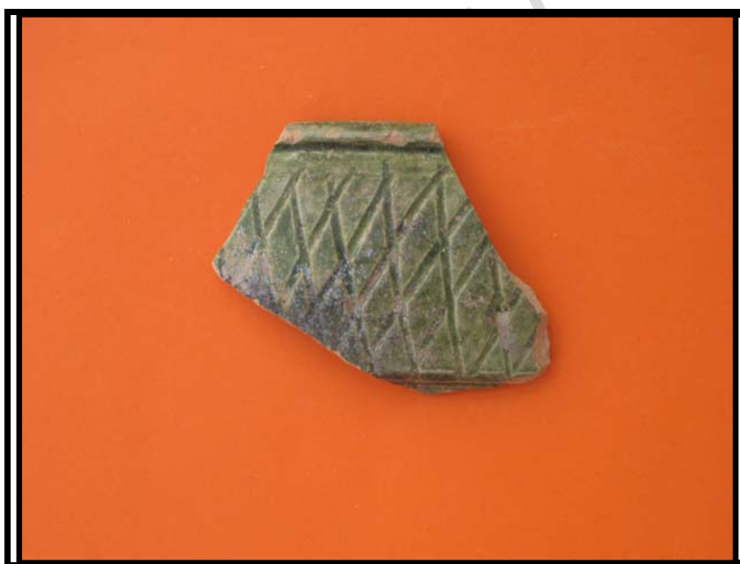
Figura 10. Borde ataifor con decoración verde incisa. C-2 U.E.10