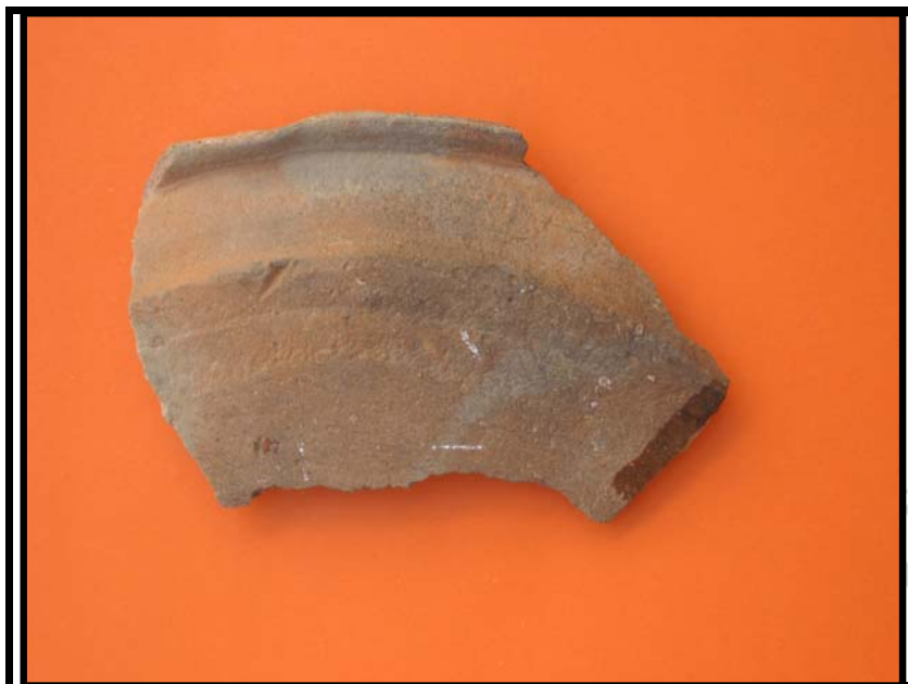
Figura 9. Cerámica de cocina. C-2 Sondeo-1 U.E.16