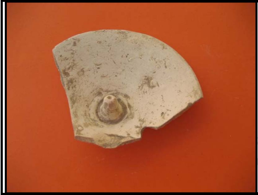
Figura 11. Tapadera pasta pajiza. C-1 U.E.12