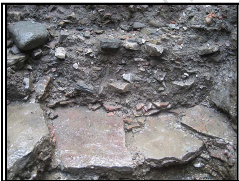
Foto 11. Suelo asentado sobre el nivel geológico de arena de playa. U.E.63 Sondeo-4 C-3