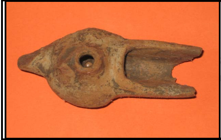
Figura 1. Lámpara aceite. C-1. U.E.10 Vista cenital