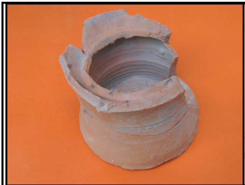
Figura 13. Anafre. C-2 Sondeo-1 U.E.17