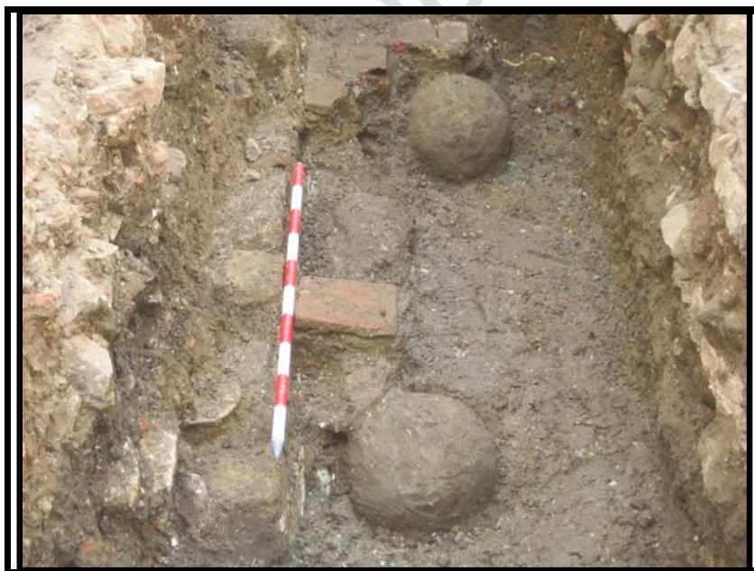
Foto 7. C-2 U.E.30. Bolaños.