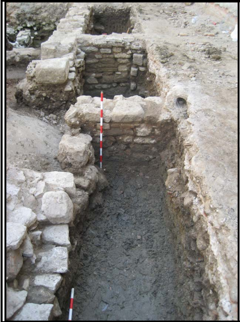
Foto 9. Estructuras U.E.33 y U.E.31 perpendiculares al muro U.E.34. II fase medieval