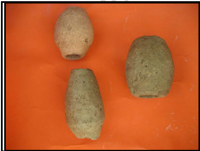
Figura 4. Ponderales de Pesca. C-1 U.E.10