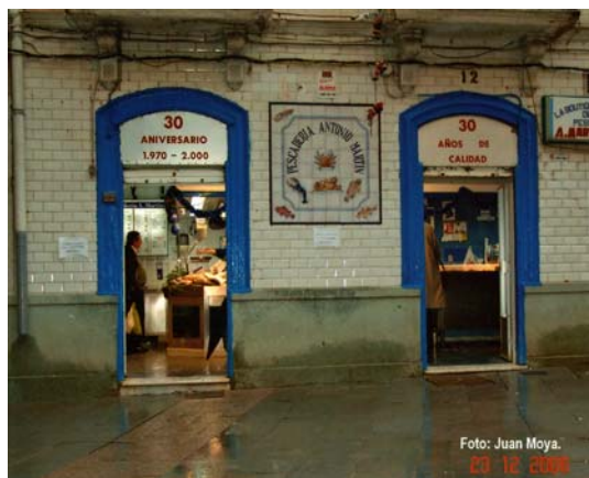
Fig. 1 Fachada de la Pescadería Martín situada en el solar excavado.

El presente Informe recoge los resultados de los trabajos arqueológicos realizados en el yacimiento de la C/ Canovas del Castillo 12 (Algeciras, Cádiz), referencia catastral: 00128**TF8001S0001RD. Parcela: 02. Los trabajos de excavación se realizaron entre el 4 de septiembre y el 3 de Octubre de 2007. La intervención en el yacimiento vino motivada por el proyecto de construcción de un edificio de apartamentos y local en bruto, cuya cimentación, según el proyecto arquitectónico, será la inserción de una losa de hormigón. En este caso el solar se hallaba en una zona de alto riesgo arqueológico, por lo que la intervención arqueológica era obligada.