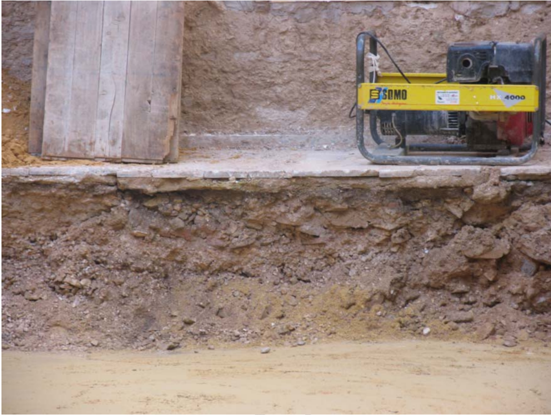
Figura 2.- Perfil E del solar tras el rebaje del terreno.