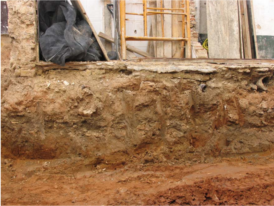
Figura 2.- Perfil S del solar tras el rebaje del terreno.