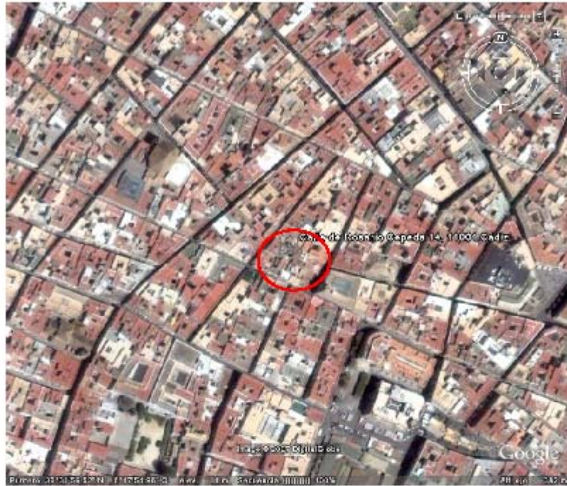
LÁMINA II.- Localización del solar en su entorno inmediato.