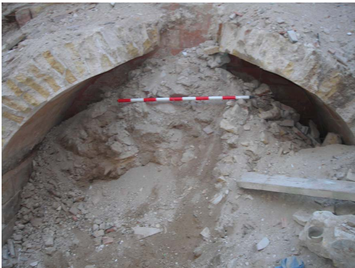
LÁMINA VII.- Interior del aljibe.