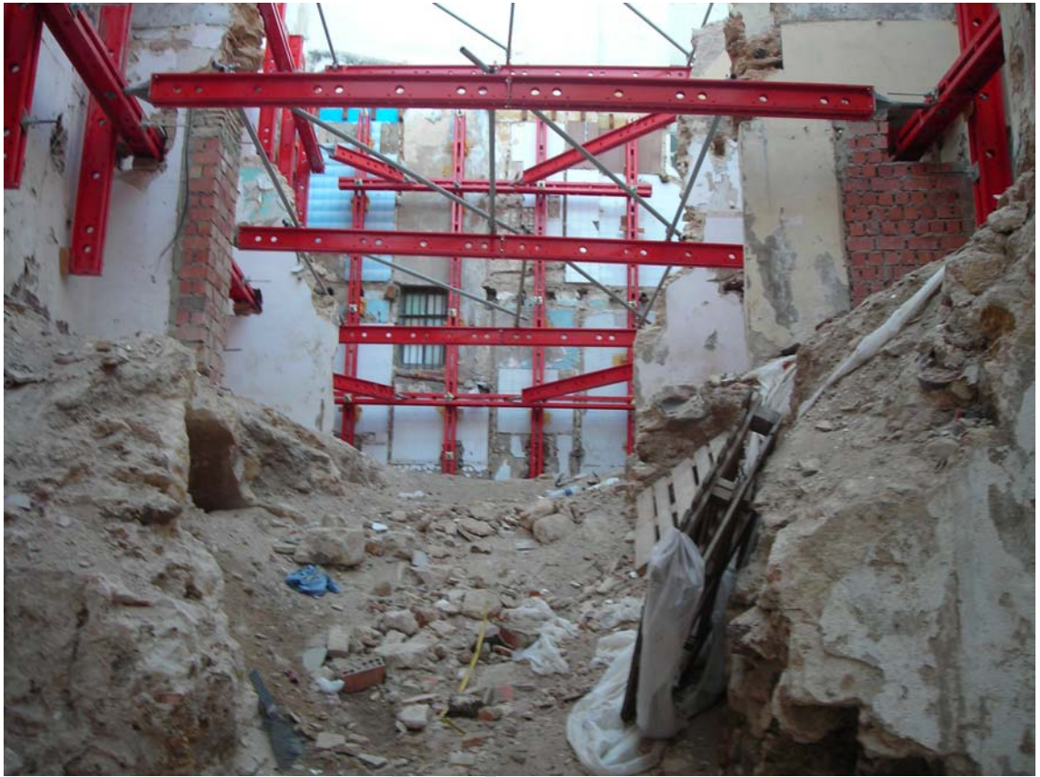
LÁMINA V.- Vista general del solar.