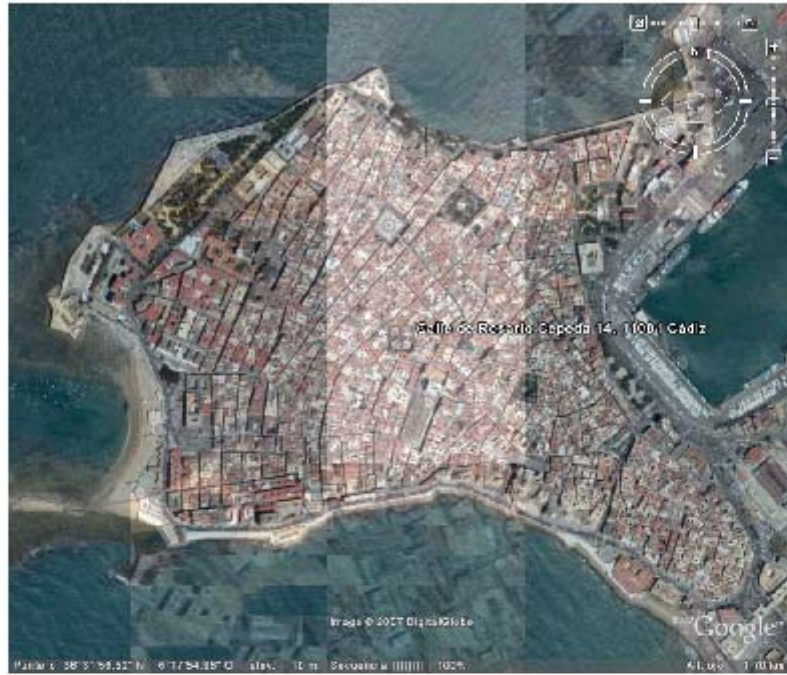
LÁMINA I.- Localización del solar en la ciudad de Cádiz.