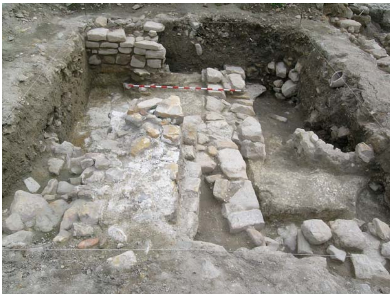
VISTA GENERAL SONDEO 2

Situado al oeste del sondeo 1, en la zona central del solar, en su lado sur, en uno de los entrantes del solar. Presenta unas dimensiones de 5,00 x 4,00 m., con una potencia máxima de uno 1,40 m.