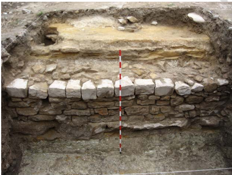
VISTA GENERAL SONDEO 5

Se localiza al norte del solar, junto a la calle y al oeste del sondeo 4. Sus dimensiones son de 5,00 x 4,00 m., y su potencia máxima por su lado oeste, más profundo, es de 2,20 m. este sondeo lo ampliamos en su ángulo noreste, con una cata de 3,00 x 3,00 m., con el fin de poder documentar la evolución de la calle.