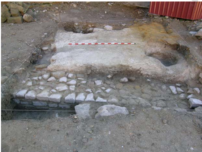
VISTA GENERAL SONDEO 4

Situado en la zona noreste del solar, junto a la calle y paralelo a esta. Sus dimensiones son de 5,00 x 4,00 m. y su potencia es mínima ya que se encuentra sobre el banco de roca.