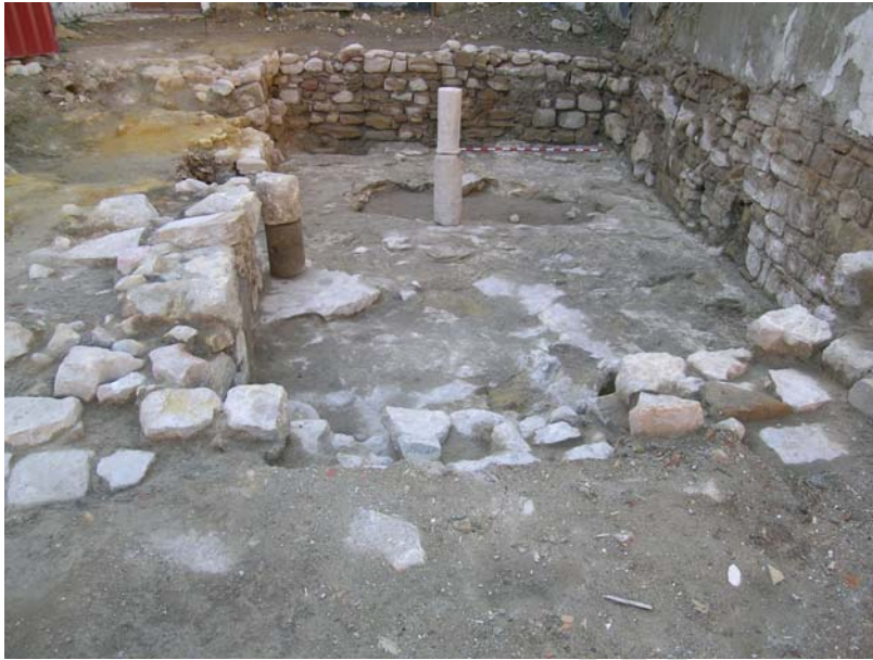
VISTA GENERAL SONDEO 1.

En su interior se han documentado parte de tres columnas, una en la esquina noroeste, otra hacia el centro de la cantina, en este caso se han documentado parte de dos fustes una sobre otro. Y la última junto a la entrada a la cantina. Por las características de las columnas, cada tambor o parte de fuste es diferente, no están ancladas a la superficie, estas columnas debieron de ser reutilizadas y probablemente su función no fue la de sustentar la techumbre de la cantina.