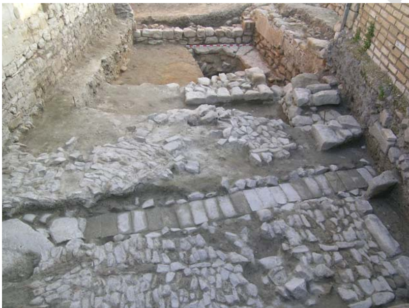
VISTA GENERAL SONDEO 3

Se sitúa en la zona sur del solar, al oeste del sondeo 2 y al sur del sondeo 6, en uno de los entrantes del solar, ocupando toda la anchura de este entrante. Presenta unas dimensiones de 10,20 x 4,80 m. Su potencia máxima es de unos 2,30 m.