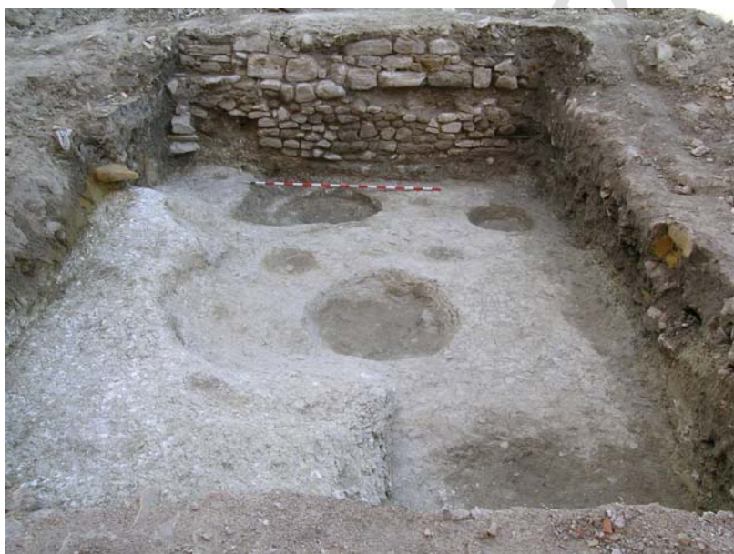
VISTA GENERAL SONDEO 6

Se han documentado varias fosas o pozos, circulares excavados en la roca.