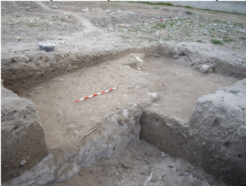
Lámina 2: Planta Final del corte 14.

En la zona Sur del sondeo aparece una fosa de época contemporánea que ha sido rellenada con escombros, pudiéndose detectar parte de las baldosas de terrazo que formaban el pavimento del patio como relleno de la zanja.