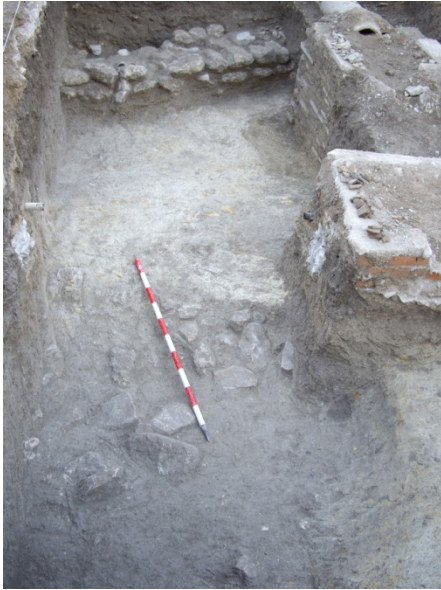
Lámina 5: Planta Final corte 20