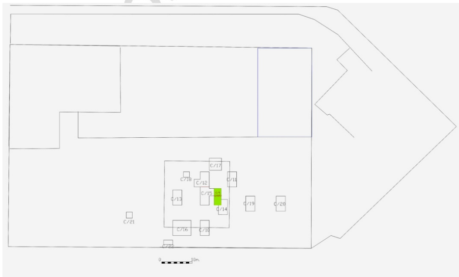
Figura 2: Situación de los sondeos.

Por esta razón, el primer paso realizado fue la limpieza del Corte ya excavado en 2005, puesto que este fue cubierto con malla geotextil echando sobre esta la tierra que se había sacado en su excavación.