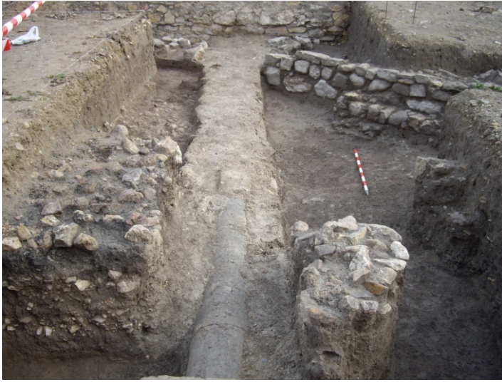
Lámina 3: Planta final del corte 15