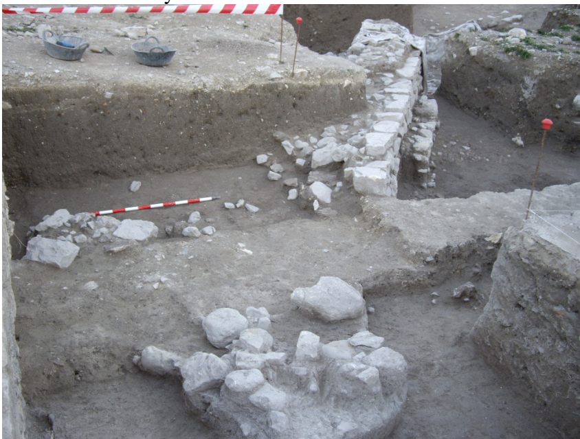
Lámina 1: Planta final del corte 12

En la zona Norte del sondeo se documenta bajo los niveles de huertas un pavimento de mortero amarillento y piedra de época romana y que aparece igualmente en los sondeos 11 y 17.