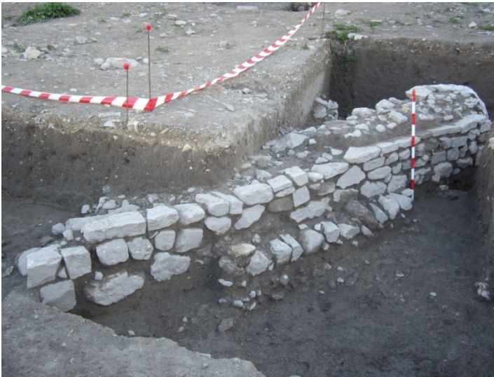
Lámina 4: detalle del muro de época romana reutilizado en época emiral.