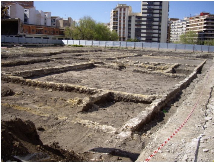
Lámina 6: Vista de la zona Norte del solar.