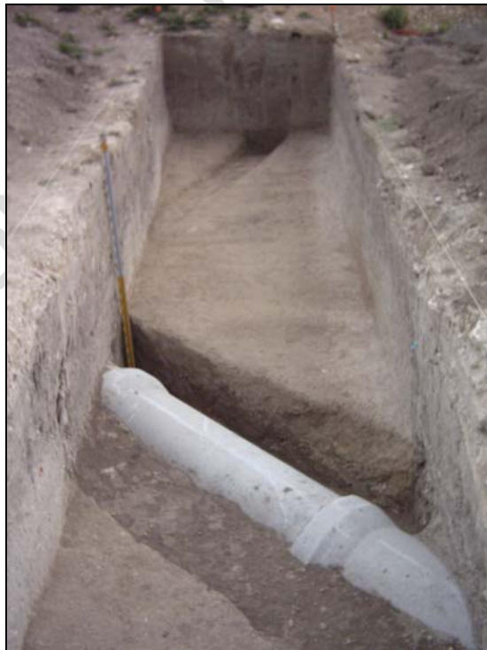
LÁMINA 1: Tubería.

En los sondeos 3, 4 12 y 13, se registró la presencia de una tubería de aproximadamente 1,00 de diámetro, con una dirección SE-NW. Los trabajos realizados para la colocación del tubo llegaron hasta el sustrato geológico, debido a estos trabajos, la estratigrafía de los sondeos ha sido alterada por los niveles de relleno contemporáneo (LÁMINA 1).