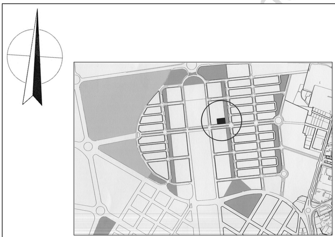
Fig. 1: Situación del solar dentro del parcelario.

En la parcela RC4-F del SUNP1, situada en la Zona Arqueológica de Marroquíes Bajos de Jaén, se va a llevar a cabo la construcción de 34 viviendas de Protección Oficial. Las viviendas constarán de 22 locales trasteros y de un aparcamiento subterráneo para 24 plazas.