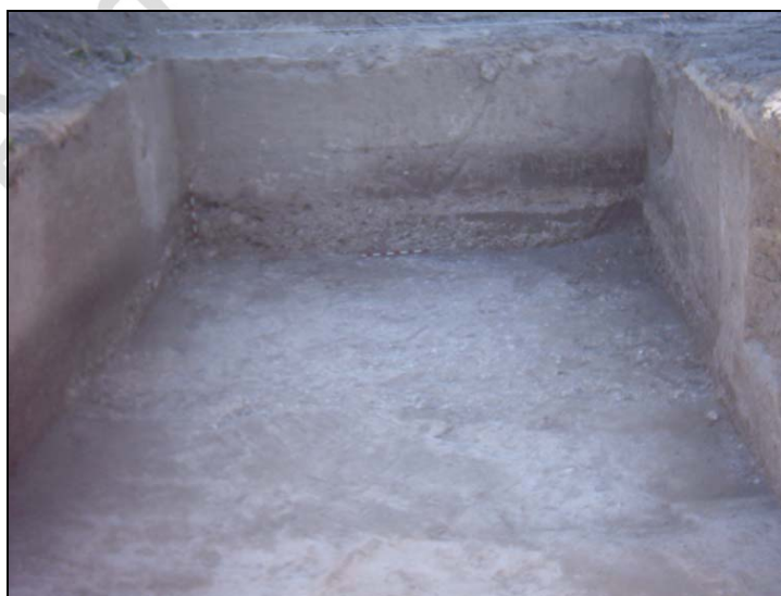
LÁMINA 2: Transect perfil oeste (detalle arroyo).

Las evidencias arqueológicas registradas en el solar se relacionan directamente con el arroyo de la Magdalena, quien registra una secuencia arqueológica casi continuada desde época prehistórica hasta la actualidad. Como hemos dicho, solo se registraron evidencias cerámicas en los diferentes lentes de cauce que forman el arroyo (LÁMINA 2). Al encontrarse los niveles arqueológicos del solar muy alterados, en el cauce solo se registraron niveles que contenían cerámica de época medieval en muy mal estado de conservación y muy rodados, y evidencias de época romana también muy rodadas y con gran cantidad de fauna relacionada.