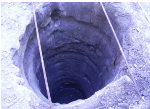
Fig. 3: Pozo Sur

El segundo pozo mencionado presenta estructura cuadrada y esta casi en su totalidad excavado en la roca y levantado después en altura con un muro de piedra viva. Este muro se encuentra situado en la cara Oeste del pozo y ahí documentamos una “mineta” o camino de acceso al pozo para proceder a su limpieza. Esta “mineta” toma una cota de profundidad de unos 3.00 metros aproximadamente en su parte mas profunda. Por seguridad no se ha seguido profundizando debido a que nos encontrábamos en contacto con la cara oeste del pozo, hecho de piedra sin ningún tipo de unión, y había riesgo de posible derrumbe de dicho muro. Esta “mineta” presentaba en su inicio unos escalones excavados en la Base Geológica e iba profundizando.