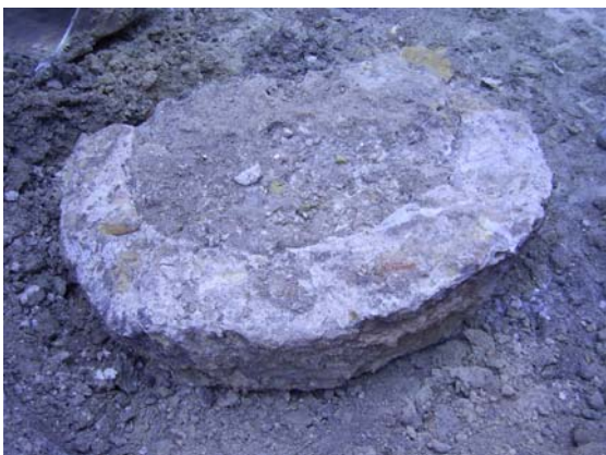
Fig. 6: Pileta de cal y canto

con cascotes, cal y deshechos de piedras, que se localizó justo en la confluencia de los dos solares que ahora es uno, pues hemos de decir que se trataba de dos viviendas contiguas que se han derrumbado y la pileta aparecía justo entre los límites de las dos viviendas.