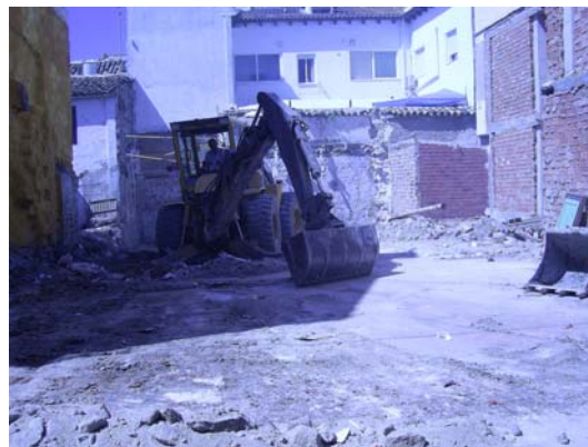
Fig.1 : Trabajos de limpieza mecánica

superficial de la parcela y la excavación propiamente dicha.