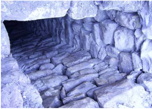
Fig. 2: Pozo Norte