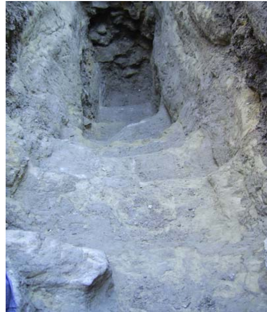
Fig. 4: Escaleras Mineta

El segundo pozo mencionado presenta estructura cuadrada y esta casi en su totalidad excavado en la roca y levantado después en altura con un muro de piedra viva. Este muro se encuentra situado en la cara Oeste del pozo y ahí documentamos una “mineta” o camino de acceso al pozo para proceder a su limpieza. Esta “mineta” toma una cota de profundidad de unos 3.00 metros aproximadamente en su parte mas profunda. Por seguridad no se ha seguido profundizando debido a que nos encontrábamos en contacto con la cara oeste del pozo, hecho de piedra sin ningún tipo de unión, y había riesgo de posible derrumbe de dicho muro. Esta “mineta” presentaba en su inicio unos escalones excavados en la Base Geológica e iba profundizando.