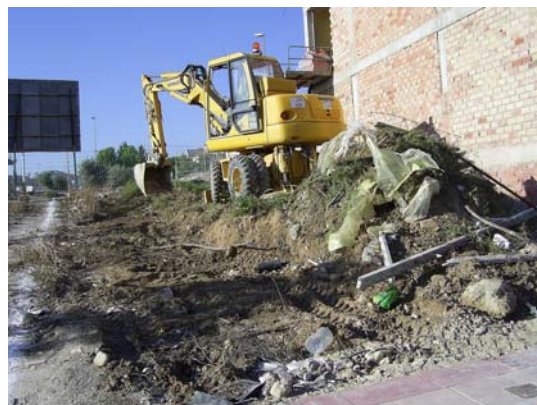
Lám. I: Trabajos de máquina giratoria

acumulaciones de escombros en superficie se realizaron empleando una máquina giratoria.