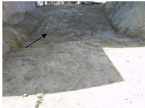
Lám. IV: Rampa de acceso al Norte de la parcela.

Sin embargo en el extremo Norte del solar la excavación no ha alcanzado la misma cota de la mitad Sur, sino que se ha dejado el terreno en forma de rampa para permitir el acceso de la maquinaria al solar. A pesar de todo consideramos que no sería necesario controlar posteriormente la excavación de esta zona puesto que esta rampa ha sido excavada en el sustrato geológico, en el que no se ha detectado ningún tipo de vestigio arqueológico.