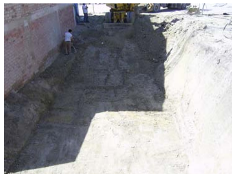
Lám. V: Franja de tierra en el lateral W de la parcela.

Además tenemos que decir que en el lateral Oeste de la parcela, una vez completada la excavación mecánica y debido a la aparición de una bolsa de agua (probablemente consecuencia de la acumulación de aguas debida a las recientes lluvias), se optó por volver a crear un cordón de tierra ataluzado junto al muro de la vivienda colindante (en proceso de construcción) tanto para evitar la nueva aparición de agua como por motivos de seguridad (para no dejar al aire la cimentación de dicha vivienda, con los peligros que esto podría suponer).