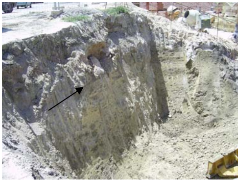
Lám. II: Franja de terreno al Sur de la parcela.

Igualmente hay que indicar que dada la profundidad alcanzada con la excavación de la parcela (sobre todo en la mitad Sur, donde la cota de la calle Catalina Mir Real que sirve como límite al solar es bastante superior a la cota que presenta la calle que lo delimita por el Norte, calle Cantaora Rosario López ) se ha optado por dejar los perfiles en talud para evitar de este modo su derrumbe.