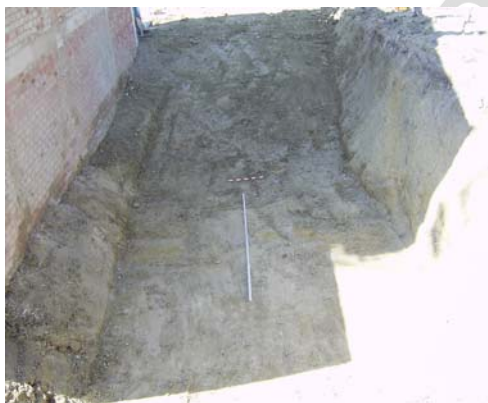
Lám. III: Perfil Este ataluzado de la parcela

Igualmente hay que indicar que dada la profundidad alcanzada con la excavación de la parcela (sobre todo en la mitad Sur, donde la cota de la calle Catalina Mir Real que sirve como límite al solar es bastante superior a la cota que presenta la calle que lo delimita por el Norte, calle Cantaora Rosario López ) se ha optado por dejar los perfiles en talud para evitar de este modo su derrumbe.