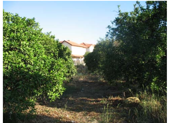
Lám.III.: Detalle parcela.