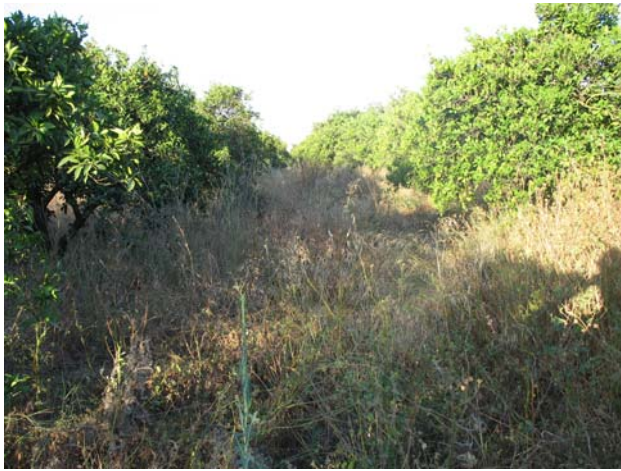
Lám.II. Detalle parcela.