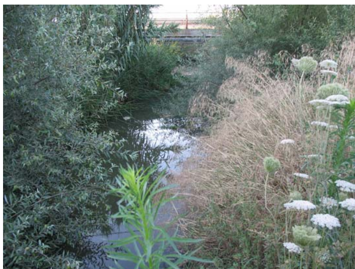
Lám.I. Arroyo Majalberraque

No se apreciaron restos de estructuras o signos evidentes de ocupación espacial del territorio prospectado, así como tampoco se documentaron restos de materiales constructivos y/o de edificación.