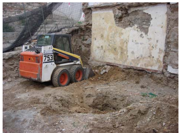
Perspectiva del lateral norte del solar. Se ve el relleno bajo la escalera. A la derecha comienzo de los trabajos de excavación con máquina.