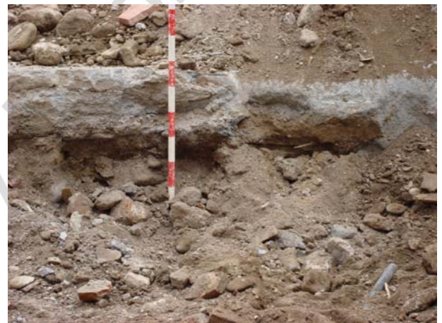
Perspectiva de la excavación en el lateral oeste. Se ve el relleno bajo el bordillo de la calle. Abajo Perspectivas del solar acabados los trabajos.