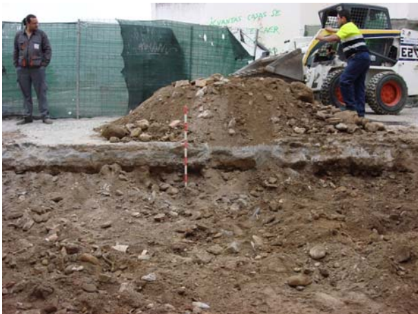
Relleno bajo la escalera.