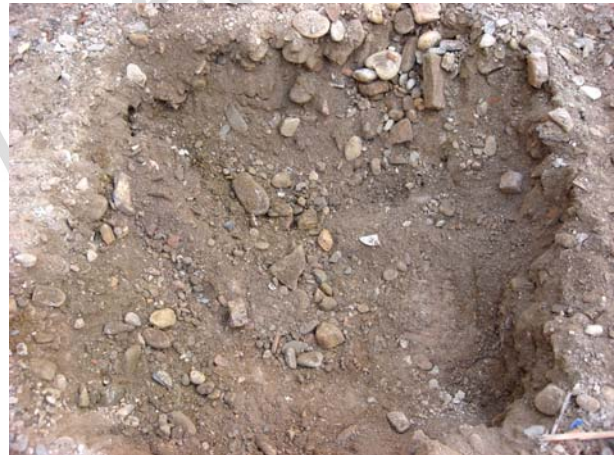
Cata previa a la modificación de la cimentación.