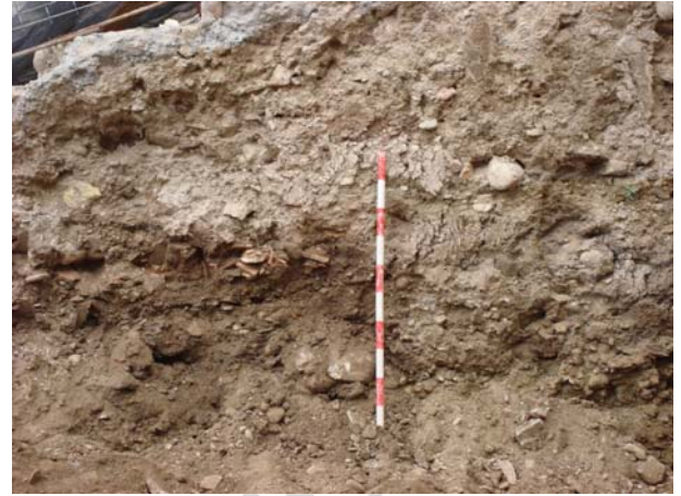
Perspectiva del lateral norte a cota acabada.