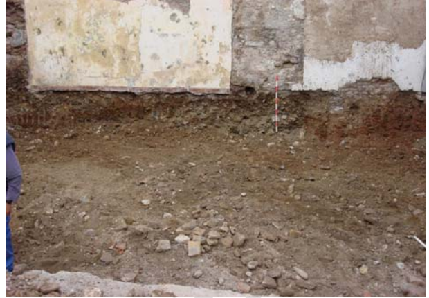
A la derecha perspectiva del frente