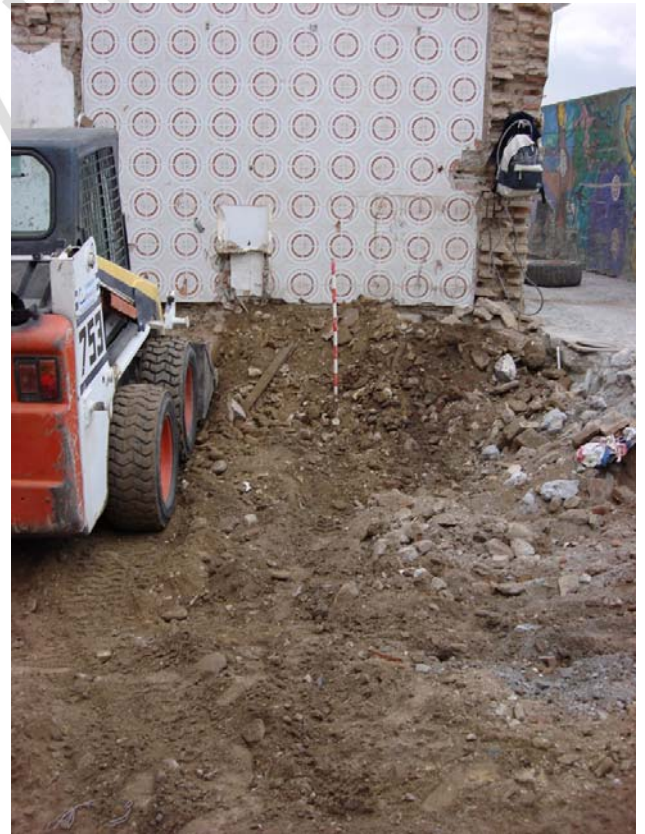
Perspectiva de los materiales del lateral sur.