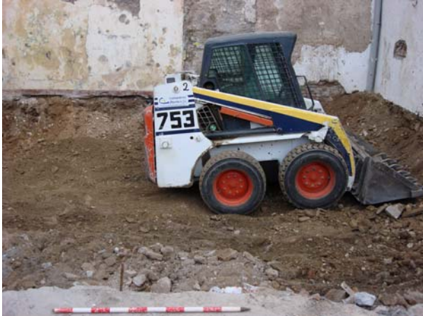
Trabajo de la máquina en el lateral este. oriental a cota acabada.