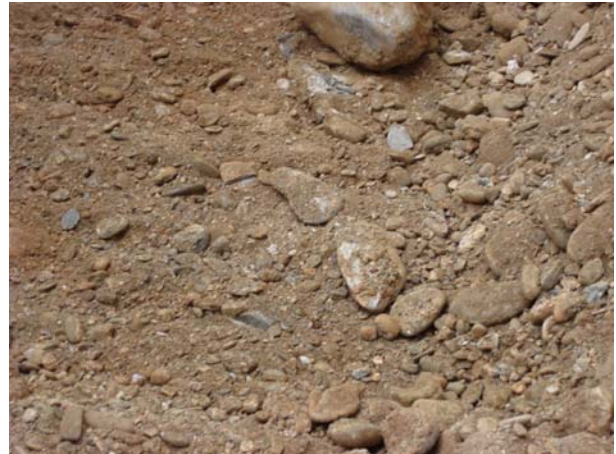
Perspectiva de la excavación en la esquina noreste. A la derecha relleno de grava y arena. Material más abundante en el solar.