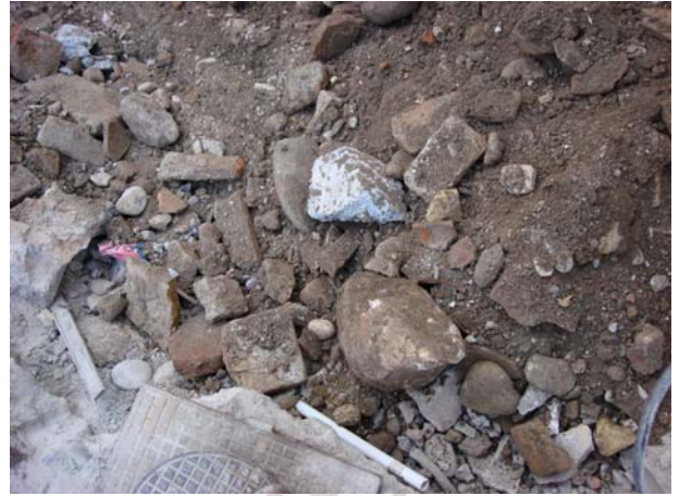
Desarrollo de los trabajos de la máquina. A la derecha materiales que aparecen bajo los bordillos de la calle.