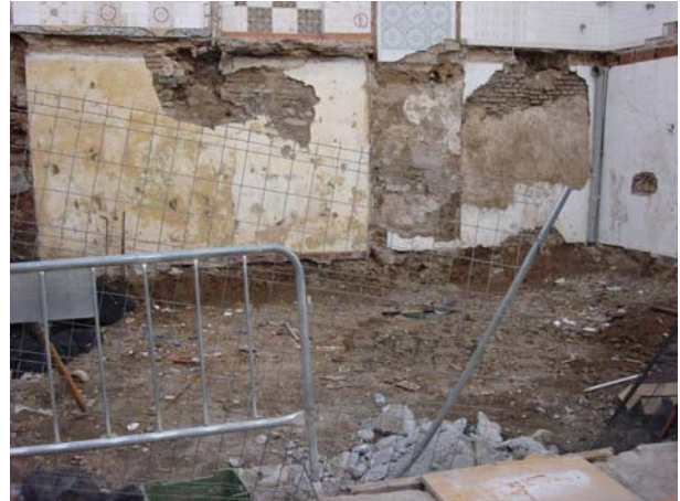
Perspectiva del solar desde la calle Zenete. A la derecha, estado del solar antes de comenzar los movimientos de tierras.