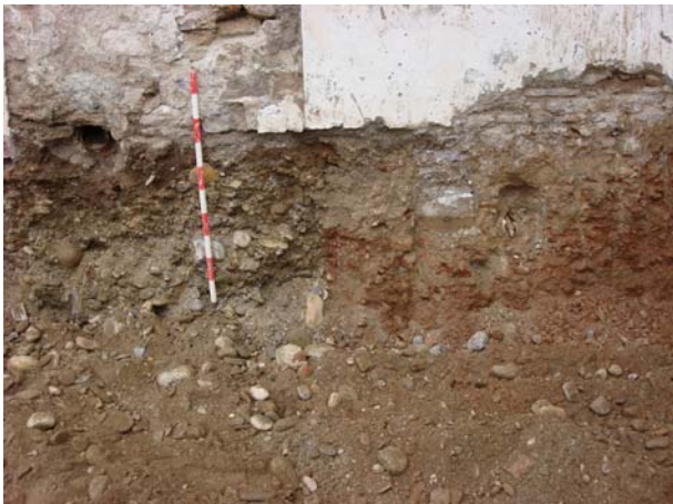
Detalle del frente este a cota acabada. Se ve el contacto de las gravas con el material arcilloso rojo. Abajo perspectiva y detalle del lateral sur a cota acabada.