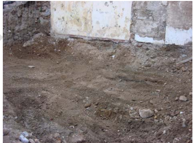
Perspectiva de los trabajos de la máquina. A la derecha Perspectiva del solar durante el desarrollo de los trabajos.