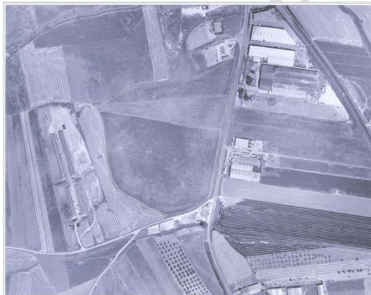
Lám. I: Ortofoto del Cerro de la Cabeza (Santiponce, Sevilla), con indicación de la delimitación del yacimiento.

suave. Topográficamente esta corrección de las curvas de nivel parece responder a acciones antrópicas. Sería, por tanto, posible conjeturar que esta alteración de la vertiente fosiliza el primitivo acceso al poblado que se halla en la plataforma superior. Además, podemos pensar en la posibilidad de que existieran otras zonas periféricas como necrópolis, zonas de actividades industriales, etc., a lo largo de todo el Cerro. En este sentido, hay que indicar que las prospecciones arqueofísicas de M. Hunt detectaron una serie de hornos y escorias de materiales en este mismo yacimiento, pero en el área del mismo que queda incluida en el Término Municipal de Salteras, al Norte.