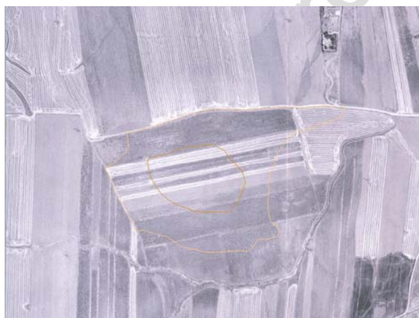
Lám. IV: Ortofoto con indicación, en color más oscuro, de la delimitación del yacimiento de “El Pleito” y con línea más clara del área de dispersión de materiales.

humanos que explican este esparcimiento sobre todo por la ladera Norte, en las proximidades al carril de la Traviesa. Allí las pendientes son mucho más pronunciadas hasta el punto que la plataforma inferior se convierte en los días de lluvias en un auténtico pantanal. Por otro lado, el borde del carril sirve de escombrera, cayendo dentro de las parcelas algunos materiales que los tractores se encargan de esparcir. Teniendo en cuenta estas variables correctoras, determinamos que el yacimiento se localizaba en la parte media y superior de la loma. En este sector no sólo se ha detectado un conjunto significativo y uniforme de materiales cerámicos, sino también piezas constructivas de gran tamaño.