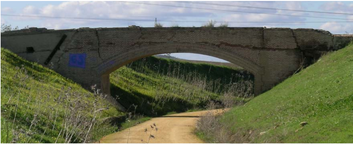
Lám. II: Vista general del Puente con la Vía Verde transcurriendo bajo él, por el recorrido que antes ocupaban las vías del tren minero.

en Vía Verde, que transcurre por esta zona encerrada en una vertiente, en parte artificial, ubicada entre dos lomas de escasa altura.