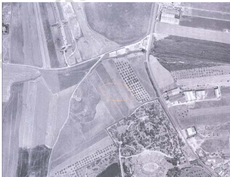
Lám. V: Ortofoto con indicación de la delimitación del yacimiento denominado "Vallehermoso I"

Propuesta de Cautela: Grado de Protección 3