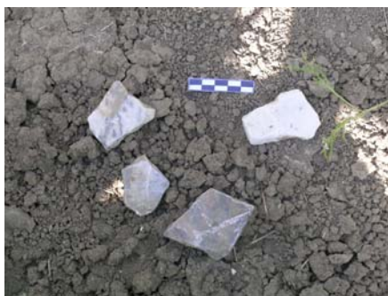
Lám. III: Aplacados de mármol detectados en el yacimiento de “El Cañuelo”

Finalmente, cabe destacar la presencia significativa de cerámicas vidriadas, principalmente lebrillos y jarras, cuya cronología abarcaría desde el siglo XVII al XX.