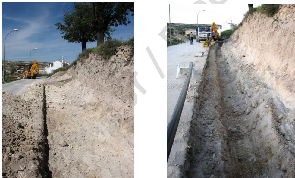
Figura 2: a: Primera fase de la actividad; b: Segunda fase de la actividad.

El control arqueológico de movimientos de tierra, que se realiza de forma mecánica realizado el 11 y 12 de mayo, se desarrolló en dos fases: la primera de ellas (fig. 2, a) consistió en la limpieza y homogeneización del terreno para la ubicación del cimiento del muro a 1,2 m de profundidad de las dos ánforas encontradas en las intervenciones anteriores, en el que se retiró una media de 30 cm de tierra al borde del camino, donde pudimos observar que el sedimento estaba removido, mezclado con cemento y latas de conservas.