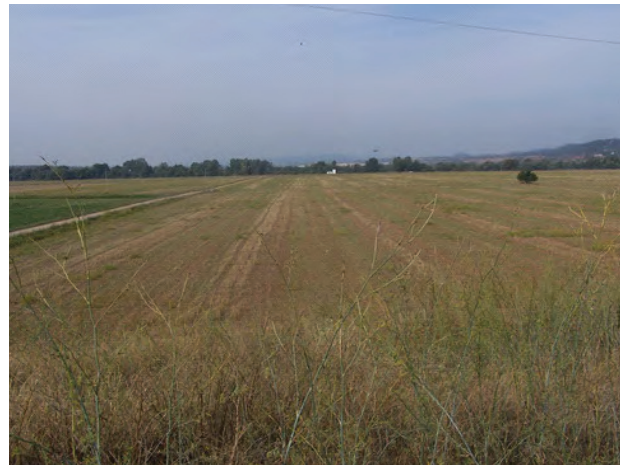
Lám. III- Vista general hacia el este del yacimiento de Buenavista.