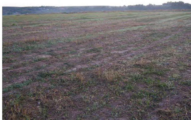
Lám. VI- Detalle de restos cerámicos muy dispersos en el yacimiento de La Capilla.