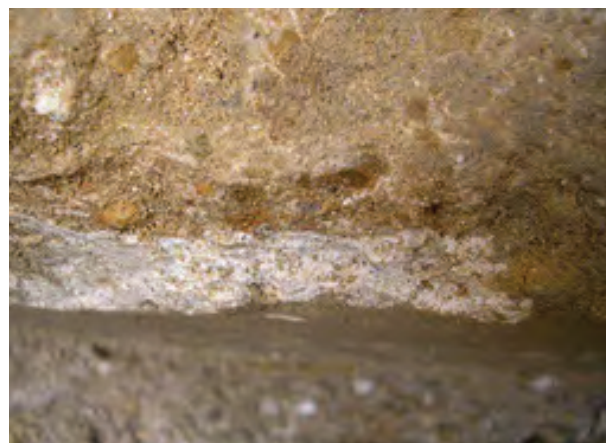
Lámina XI. Momento de la aparición de la decoración de la barbacana, banda roja y líneas transversales.

Lámina X. Ampliación de la sección del enlucido de la barbacana (crujía 2).