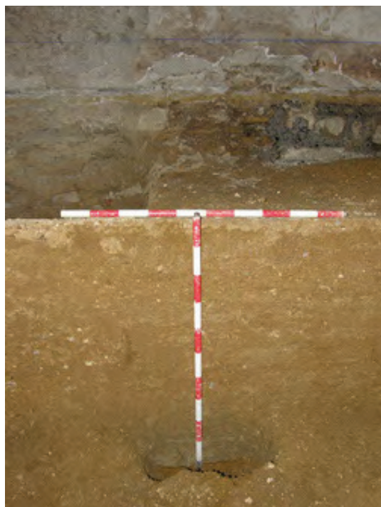
Lámina IX. Sección en la cual se puede observar la capa de enlucido (crujía 2).

Lámina VIII. Sección completa de la barbacana en la 3ª crujía.