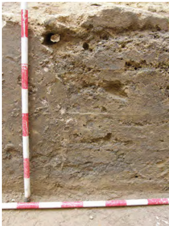
Lámina VII. Enlucido de la torre, es característico la diferenciación de las diferentes lechadas en la fabricación del tapial.

Lámina VI. Vista frontal de la aguja de los tirantes, así como de la impronta dejada por las cinco tablas del encofrado.