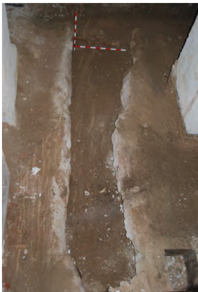
Figura 4.- Fotografía del Aljibe.