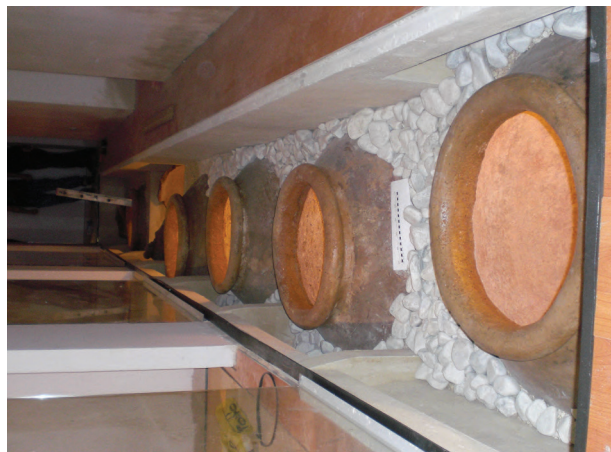
FIG 4: Tinajas en proceso de restauración