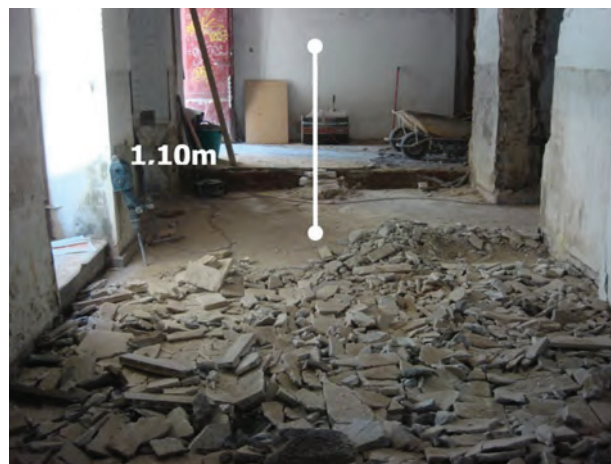
Nivel de relleno bajo la solería existente. Perspectiva de la estructura-pileta aparecida en esa zona.