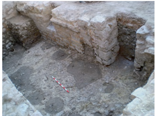
Lám. 3. Acceso al Sótano 2 por el este.