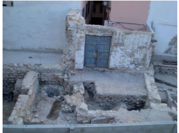
Lám. 5 Corte 2, estructuras del Espacio C.