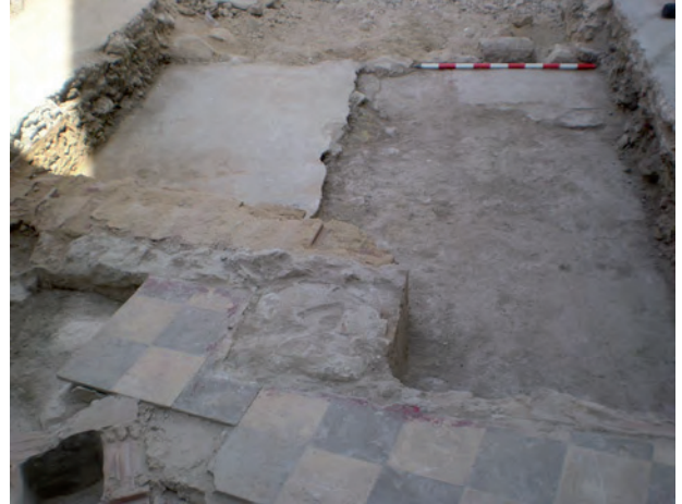
Lám. 11. Corte 3. Estructuras excavadas en la roca y estructura romana en la esquina superior derecha.