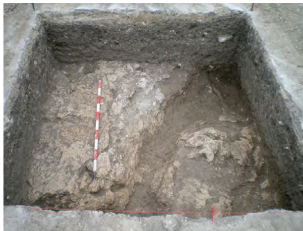
Fig. 4. Posible canalización.