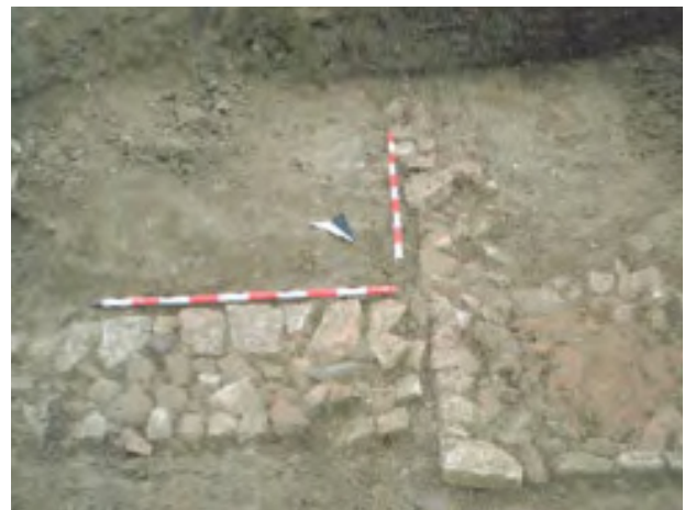
Lámina 3: Planta de las estructuras excavadas.