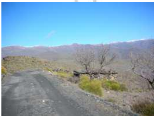
Lám., II. Estructura no afectada por las obras.

Dentro de los trabajos realizados pudimos comprobar, una gran cantidad de construcciones a piedra seca, como paratas de aterrazamiento en muchas de las parcelas para ser aprovechadas para el cultivo de distintos cereales, como garbanzos, centeno, cebada, etc., cultivos que se practicaban en todo el paraje debido al poblamiento antiguo de la zona, a raíz de las distintas construcciones a piedra seca observadas como son los restos de gran cantidad de cortijos, aljibes, corrales o rediles para albergar el ganado.