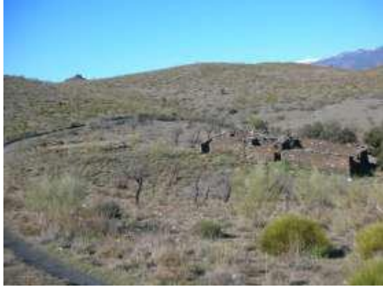
Lám., I. Cortijo no afectado, Entorno AG04.

Dentro de los trabajos realizados pudimos comprobar, una gran cantidad de construcciones a piedra seca, como paratas de aterrazamiento en muchas de las parcelas para ser aprovechadas para el cultivo de distintos cereales, como garbanzos, centeno, cebada, etc., cultivos que se practicaban en todo el paraje debido al poblamiento antiguo de la zona, a raíz de las distintas construcciones a piedra seca observadas como son los restos de gran cantidad de cortijos, aljibes, corrales o rediles para albergar el ganado.