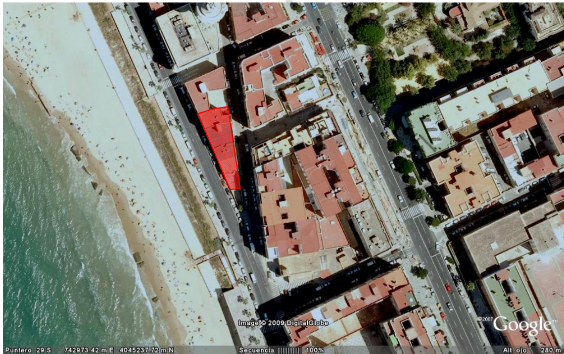
Figura 2.- Localización del solar en su entorno