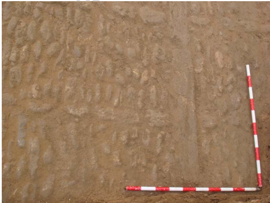
Figura 4.- Pavimento de bolos del Sondeo 1.