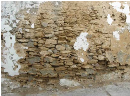
Lámina XI: La muralla presenta una fuerte pérdida de mortero, creando la pérdida de ripios, todo ello debido a la pérdida de su enlucido.

Junto a la segunda cata hemos podido observar mortero original de la muralla, el cual tiene una gran cantidad de arenas y restos calizos, procedentes de la roca ostionera. Sobre el mismo se desarrolla una gruesa capa de enfoscado con cal, sobre él se aplica un primer enlucido (ocre) que se encuentra muy deteriorado y con pérdida de material, así como con la introducción de pequeños ripios con el objeto de aplicar sobre el mismo una segunda capa de enlucido. Ambas capas conservan sus diferentes encalados, las cuales atestiguan una perdurabilidad en el tiempo de cada una de ellas.