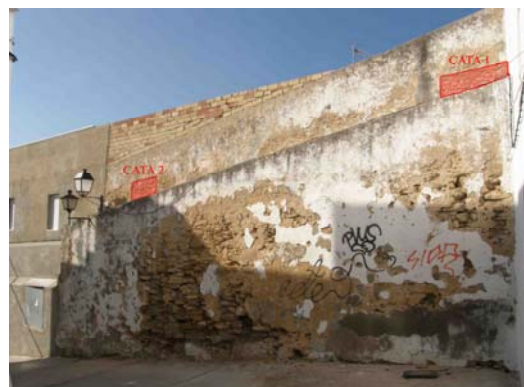
Lámina III: Localización de las catas paramentales.