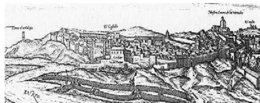
Lámian I: Conil de la Frontera en el siglo XVI, Civitates Orbis Terrarum, Hoeffnagle.

Existen escasos antecedentes arqueológicos en la zona, representados por informes realizados por los técnicos inspectores de la Delegación de Cultura de la Junta de Andalucía en Cádiz, donde los resultados habían sido negativos en cuanto al hallazgo de restos arqueológicos y de la muralla.