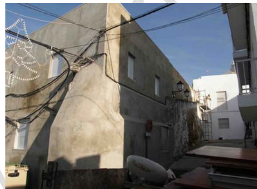
Lámina II: Vista general del lienzo de muralla en la Calle Extramuros.