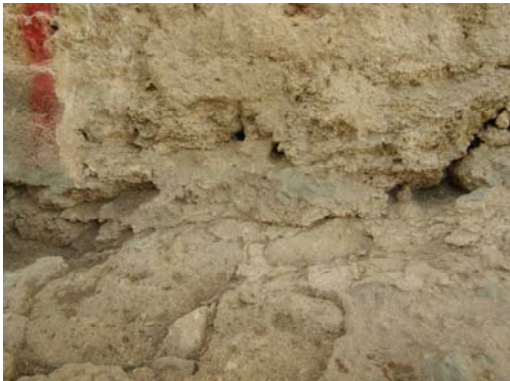
Lámina IX: Detalle del asiento del muro sobre la muralla, se puede observar como no existe ningún elemento de intersección constructivo y sí una superposición de un elemento sobre la coronación del otro. En la muralla se puede observar diferentes morteros, así como las tierras correspondientes a su argamasa principal, el muro superior presenta un mortero de cal.

muralla es del siglo XVI, el muro de coronación es una obra del siglo XVIII, como fecha más antigua asignable.