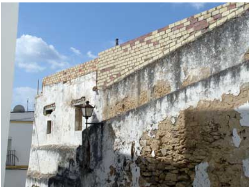
Lámina X: Estado de la muralla antes de la intervención arqueológica el día 20 de noviembre de 2009.

Se ha determinado no llevar a cabo la actuación ya que una vez iniciados los preparativos legales y físicos de intervención, observamos que el lugar sobre el cual se iba a desarrollar la actuación se ha cubierto de cemento, cubriendo no ya la totalidad del sondeo, sino la mitad del propio lienzo de muralla.