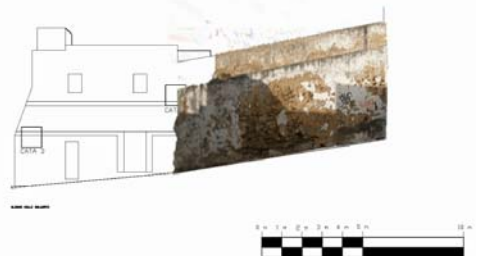
Lámina IV: Alzamiento de lienzo del muro sobre el plano.