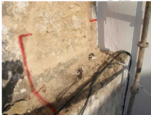
Lámina VI: Señalización de la cata 1.

Dimensiones: 1x1m. = 1m 2 de superficie.