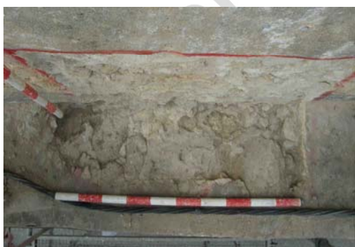
Lámina VIII: Coronación de la muralla en la segunda cata, la disposición de los ripios nos muestra su colocación sobre una lechada fresca de mortero y abundante, como puede observarse en las rebabas del mortero.

El enfoscado del murete de coronación mantiene un grado irregular de conservación, ya que en muchos lugares se encuentra muy deteriorado, provocando graves problemas en el asentamiento de los ripios. Dicha circunstancia influye en la sustentación del propio enlucido.