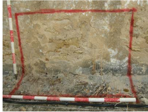
Lámina VII: Señalización y localización de la cata paramental N°2.

Dimensiones: 1x1m. = 1m 2 de superficie.