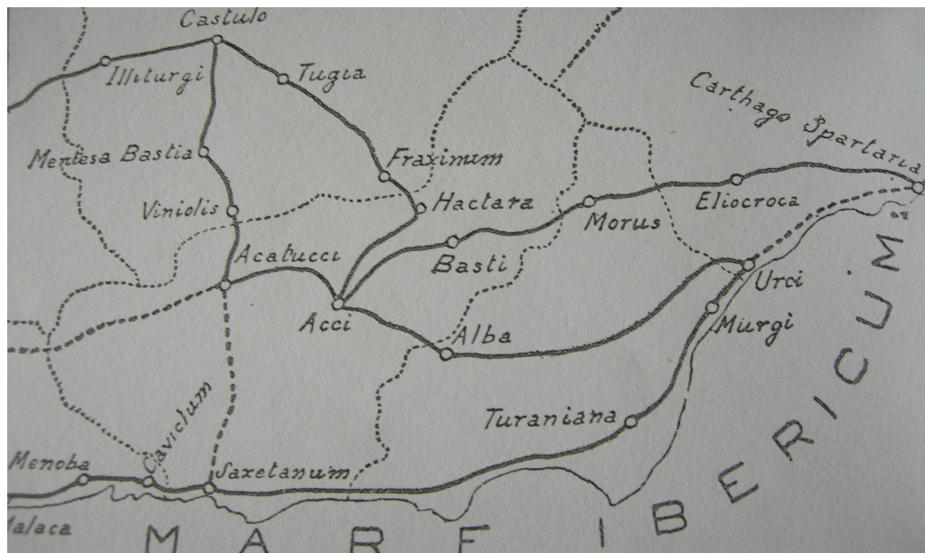
Fig 2. Hactara y otros enclaves romanos en el Itinerario Antonino (mapa extraído de Magaña 1927: 96)

El hecho de que no se hayan detectado otro tipo de restos arqueológicos en las inmediaciones del parque eólico objeto de estudio no conlleva la inexistencia de ocupaciones humanas de época romana en el entorno. Estas bien se pueden encontrar bajo tierra. Es por ello que sea importante que cualquier movimiento de tierras en la zona tenga una supervisión arqueológica en la forma de un seguimiento arqueológico de las obras que se lleven a cabo.