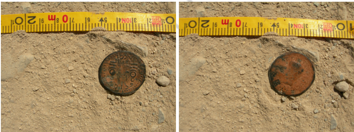
Lám. IV. Detalle sobre el terreno de la moneda en el momento de su aparición

A pesar de constituir un hallazgo descontextualizado, no hay que desvalorizar el resto material encontrado. La escasez de yacimientos romanos documentados en la Carta Arqueológica del municipio de Zújar, a pesar de que el enclave se haya adscrito a la Hactara que nombra el Itinerario Antonino , revaloriza la importancia del hallazgo encontrado.