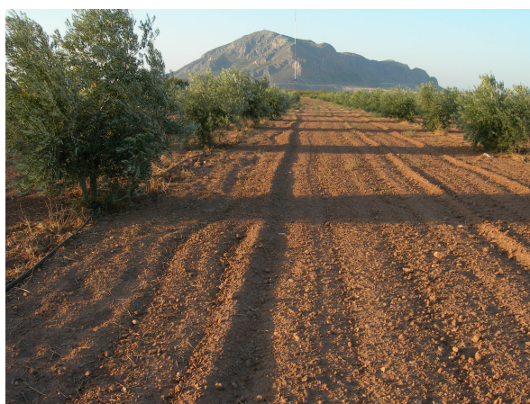
Lám. I. Paraje de instalación del parque eólico de los Llanos de la Estación con el cerro Jabalcón al fondo en dirección norte

El área de implantación del parque eólico de los Llanos de La Estación se sitúa en una pequeña meseta muy llana desde la que se tiene una amplia visión sobre la localidad de Zújar, así como de todo el área circundante en la que sobresale, a modo de una isla, la mole caliza dolomitizada del cerro de Jabalcón, con una composición geológica totalmente distinta a la de los terrenos que lo circundan. La altitud media del área de afección está en torno a los 960 m.s.n.m.