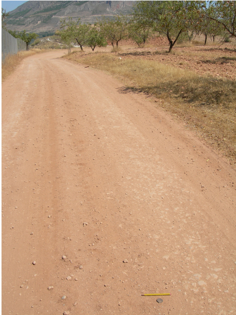
Lám. III. Moneda de bronce de época imperial en su momento de aparición