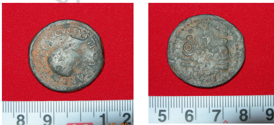
Lám. V. Anverso y reverso del as de bronce tras su limpieza

PIEZA: As de bronce romano del emperador Tiberio de la ceca de Acci (Guadix)