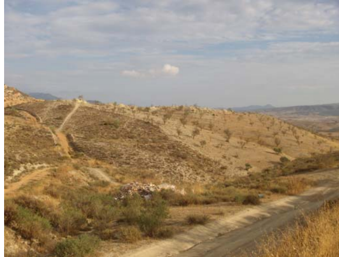
Fig. 2. Vista de la plantación de almendros que ocupa la parcela (a la derecha de la fotografía).