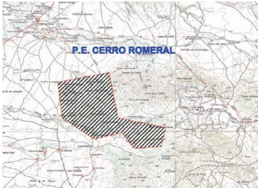
Lám. 1. Ubicación parque Eólico Cerro del Romeral.

municipales de Cúllar y Caniles, en los parajes conocidos como “Cerro del Almirez”, “Loma del Carrascal”, “Loma de la Vizcaína”, “La Jauca” y “La Cañada de los Garcías”. Dichos parajes están situados a unos 5 km al Este de Baza.