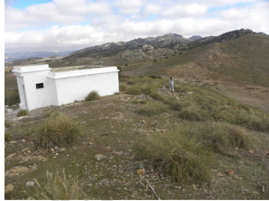
Lám. 3. Aljibe en el entorno del Aerogenerador nº 3. Parque Eólico del Romeral.

durante los trabajos de campo, no se han documentado restos o evidencias arqueológicas que nos permitan hablar de una ocupación en dichos terrenos.