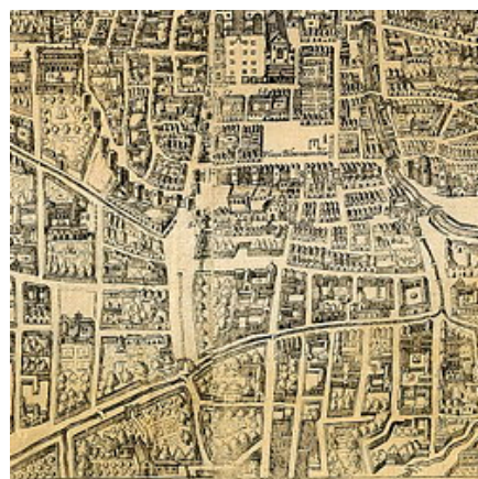
Plataforma de Ambrosio de Vico. Siglo XVI. Se ve ya configurado el barrio.

Durante el siglo XVII este sector conoció una expansión demográfica inusual en los desarrollos urbanos de las ciudades españolas contemporáneas, normalmente sometidas a procesos regresivos. En origen, la parroquia se dividía en dos partes: la zona antigua, comprendida entre la calle Alhóndiga Zayda y la plaza de Bibrambla , con el trazado irregular propio del urbanismo musulmán, y otra que llegaba hasta la actual plaza de Gracia, que corresponde con la zona de expansión, donde “ el trazado gana en regularidad y las calle cobran anchura ”(5). La frontera de ambos sectores era la antigua aduana del Lino, convertida después en una plazoleta (actual Plaza del Lino).