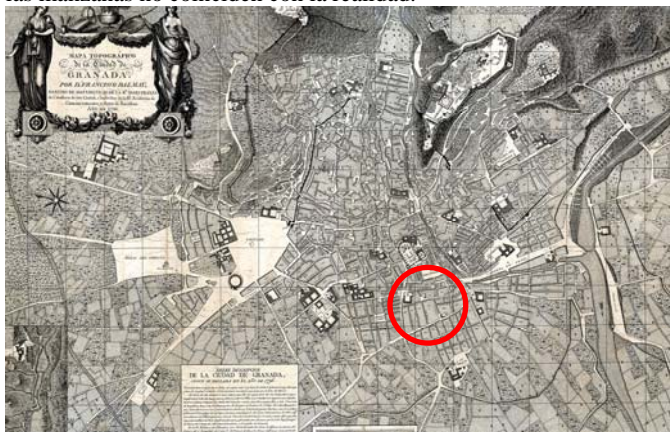
Plano topográfico de Dalamau, año 1795. Se señala la Plaza del Lino. En él se representa al barrio de la Magdalena antes del proceso de alineaciones y apertura de nuevas calles emprendido por la Comisión de Ornato Público durenta la segunda mitad del siglo XIX. El proyecto de nueva alineación de la calle Alhóndiga es de 1868.