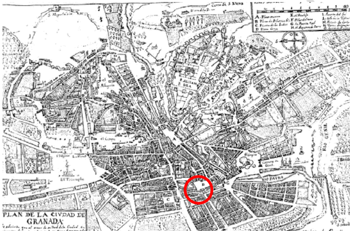
Plano Fdez. Navarrete. 1732. Este plano está en perspectiva poco real y las manzanas no coinciden con la realidad.

En el siglo XVIII era la parroquia más poblada de la ciudad baja. El crecimiento de población modificó su superficie que fue ampliándose progresivamente con nuevas calles transversales y paralelas como la de Gracia,Jardines, Puentezuelas, Águila o Verónica de la Magdalena.