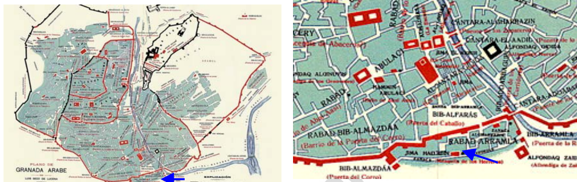
Plano de Granada árabe. Luis Seco de Lucena. Se señala el ya creado arrabal.

placeta que ahora se llama de Santo Cristo, los albarderos y los carpinteros . Sabemos de tres mezquitas y una rabita situadas en la calle principal del arrabal, tambien un aljibe que se ha conservado hasta hace pocos años y proximo un horno. En este arrabal y probablemente en la zanaqat al –Haddadin hubo un fondaq o alhóndiga”(2).