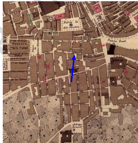
Plano de González Sevilla y Bertucchi. Año 1894. Se señala la Plaza del Lino.