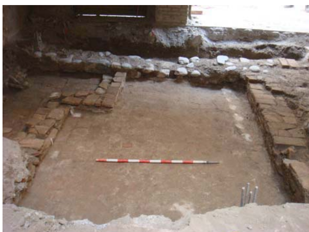
Perspectiva de los restos desde la calle. A la derecha el jalón está colocado en el límite interior de la zona excavada, coincidente con el muro que separa las crujías.