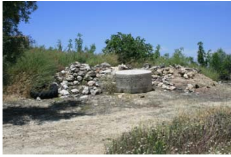
Restos de la piedra de moler.