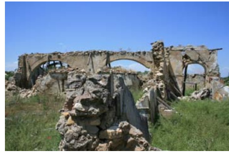
Restos del posible molino.

Teniendo en cuenta los resultados de la Prospección arqueológica superficial y con el objeto de corroborar los datos ofrecidos en esta intervención se propone la realización de un Control de movimientos de tierra durante la ejecución del Proyecto de obra, como medida preventiva.