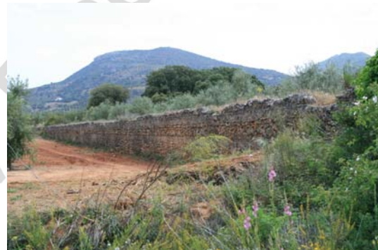
Trazado de la estructura

Molino: Restos de un posible molino. Se encuentra semiderruido aunque aún pueden distinguirse los restos de las arcadas. En un lateral se localiza una gran piedra de molino. Se sitúa en el entorno del Apoyo n°20, sin que se encuentre directamente afectado por la instalación de éste. Por este motivo este bien etnológico posee un Impacto Moderado.