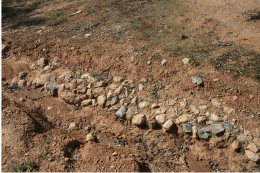
Posible yacimiento arqueológico "Vaguero".

El área no se encuentra afectada por la instalación del apoyo si bien se localiza a unos 20 metros de éste por lo que se considera que posee un Impacto Moderado.