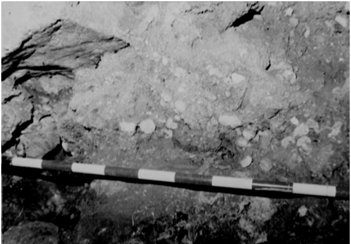
Lámina III. Detalle de un perfil del sondeo arqueológico donde se aprecian los fragmentos de coprolitos en el año 1997 (puntos blancos).