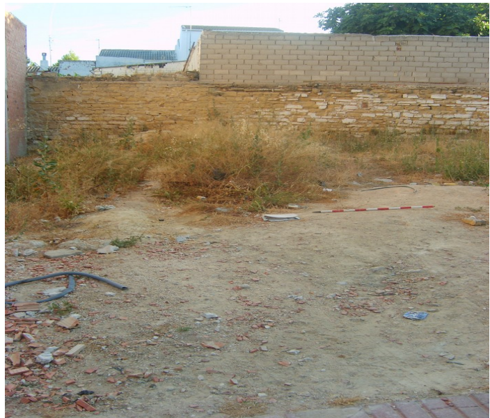
LÁM. 1. Vista general del espacio intervenido