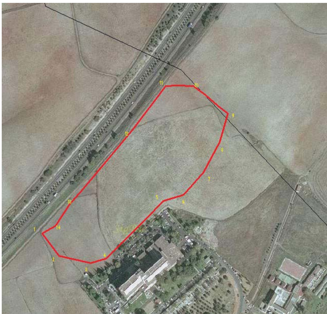
Figura 3: Delimitación del yacimiento Hospital Infanta Helena