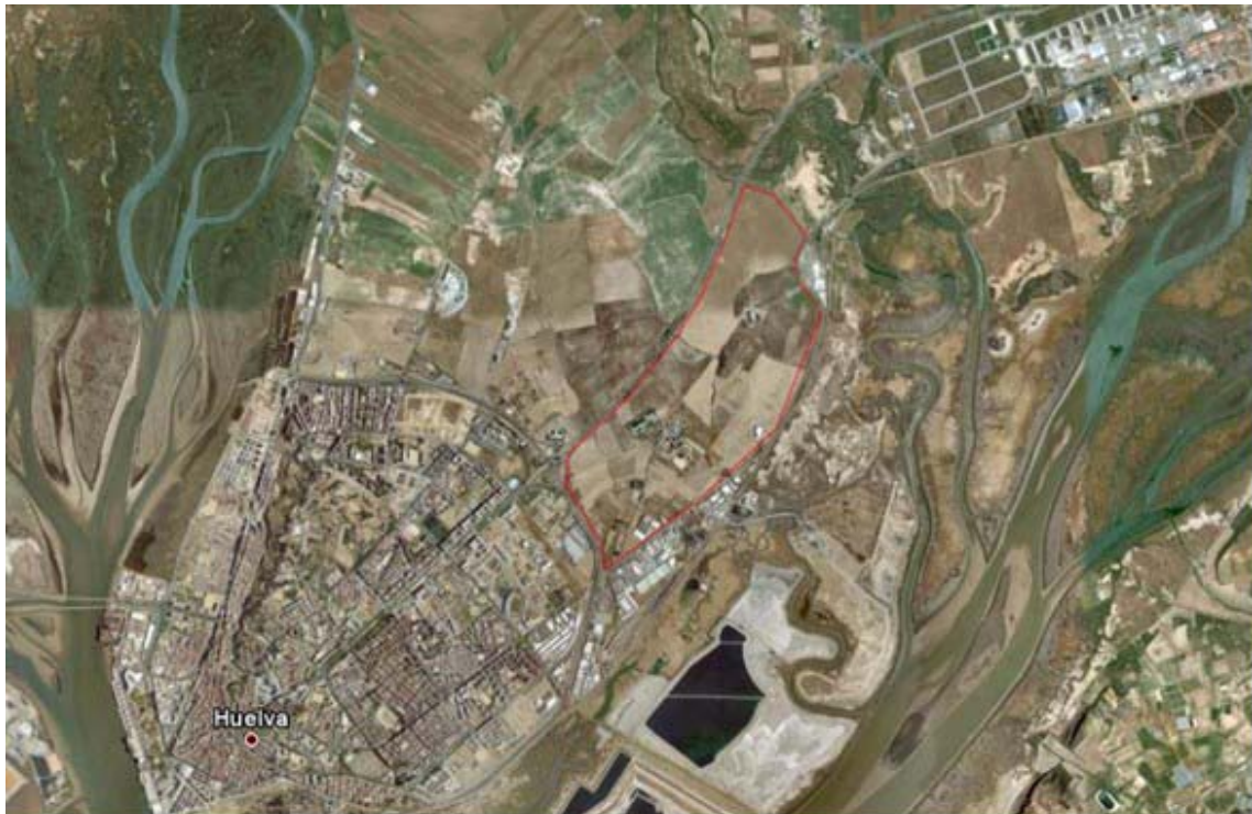
Figura 2: Imagen satélite general de Huelva y el Plan Parcial San Antonio-Montija

El ámbito del PAU N° 3, con una superficie de 2.869.300 m 2 , está delimitado al sur por la carretera H-30 Ronda Exterior de la ciudad; al oeste, por la Autovía H-31 de acceso a Huelva desde Sevilla, al norte por la ribera de la Nicoba y el ferrocarril Huelva-Zafra y al este por la carretera A-5000, con una pequeña discontinuidad producida por la Unidad de Ejecución n° 16 y el Plan Parcial n° 6.