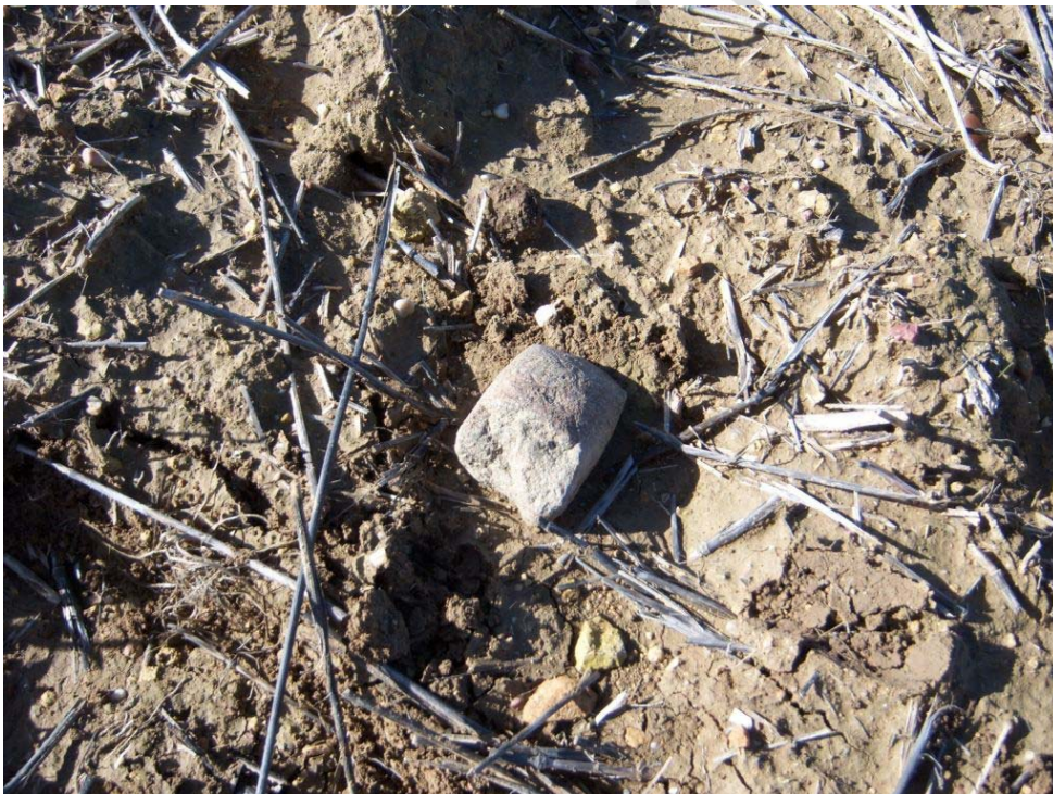
Figura 5: Hacha pulimentada recogida al noroeste de la Parcela 31

No obstante, los datos bibliográficos, así como la pervivencia de la ocupación humana en esta zona, aconsejan precaución a la hora de acometer acciones que supongan alteración de su subsuelo.