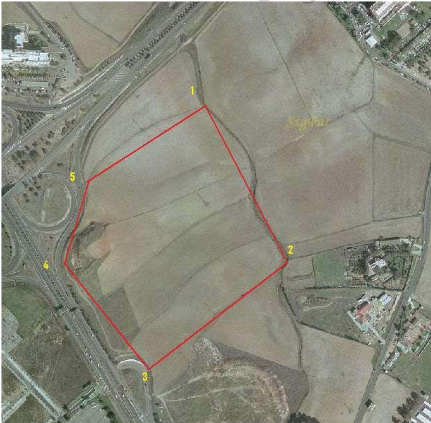
Figura 4: Delimitación para el yacimiento Entrada a la Autovía propuesta por la empresa G.I.R.H.A.

El estudio de las fotografías aéreas realizadas en esta zona en 1950, nos permite constatar que antes de la construcción de la actual vía de acceso a la A49, existía un cerro que presentaba un excelente control visual de su entorno. Por este motivo, parece factible pensar que parte de este yacimiento se viera afectado cuando el cerro fue cortado para la construcción de dicha vía, lo que haría más difícil su identificación hoy en día.