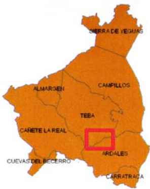
Comarca del Guadalteba