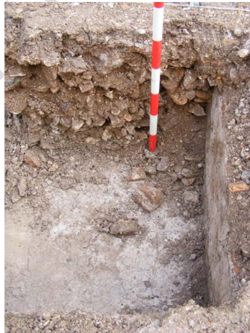
Lám.IV. Proceso de excavación de la pileta