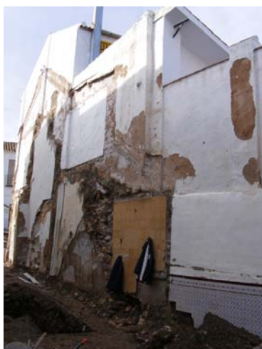
Lám.I. Medianera norte

La crujía de fachada con cubierta a dos aguas conserva en la actualidad dos cargaderos de vigas adosados a los paramentos medianeros sobre los que se sustentaría la techumbre, seguramente formasen un muro continuo divisor de dos estancias, como ocurre con la segunda crujía conservada de la que se observa la cimentación de uno de estos paramentos, de la que hoy día restan solo los cargaderos de las vigas.(UE. 5 )