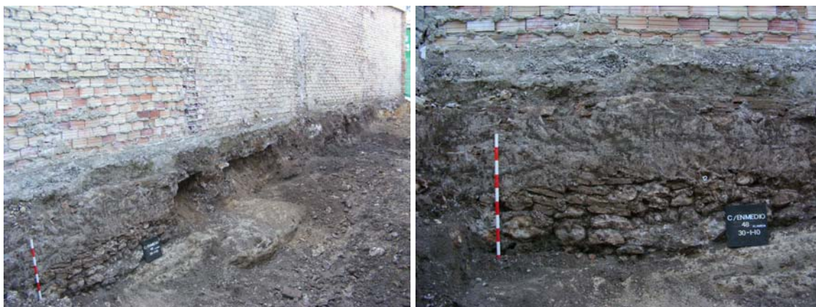
Lám.IX-X. Medianera sur y foto detalle de la obra mixta contemporánea con revoco en yeso.

A la finalización del Sondeo-1, en su proceso de excavación manual le sucede, dada la ausencia de restos arqueológicos, el control de los movimientos de tierra, cuyos resultados corroboran aquellos derivados de la excavación arqueológica.