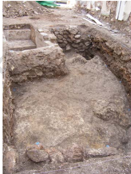
Lám.VIII. Orografía del terreno.

La unidad paramental UE.5, de la que damos imágenes de su coronamiento y cimentación se sitúa en el perfil este del sondeo. Su paramento presenta la característica de estar realizado en mampuestos de mediano tamaño trabados con tierra, y al menos la cara visible presenta un revoco de yeso, lo cual indica que dicha estructura fue realizada en momentos previos a la colmatación del geológico, en algunos casos en contacto directo con el arcillón y en otros sobre un estrato de tierra arcillosa marrón sobre la que establecen los mampuestos de manera vertical. El suelo de cantos que aparece se encuentra adosado a dicho paramento, perteneciente al límite del patio con la zona de habitación, ambas coetaneas.