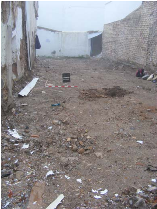
Lám.III. Replanteo del Sondeo-1

Una vez finalizado la limpieza del solar se realiza el replanteo de la cuadrícula, un único sondeo, de dimensiones 3x 6m. Se comienza la excavación por el sector este del sondeo, en el que se dejan intuir restos constructivos que por sus materiales indican su adscripción a la época contemporánea. Se constatan rellenos homogéneos sin compactar, con abundancia de restos en materiales de construcción como ladrillos fragmentados y abundantes restos de yeso, en la mayoría de los casos similares a los que colmatan el geológico del resto de la parcela.