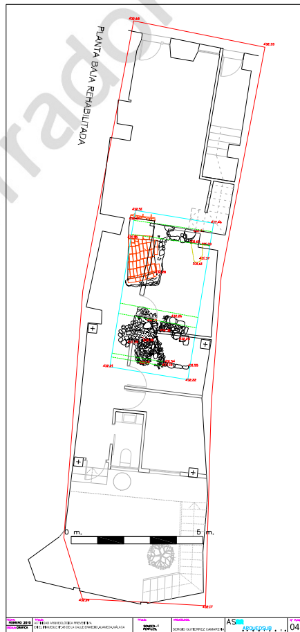
Fig.3.Planta final de excavación en el inmueble.