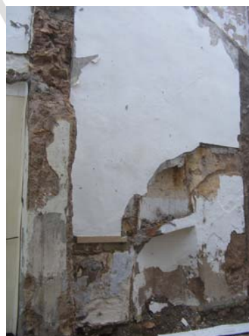
Lám.II. Amortización de la chimenea.

En la medianera norte encontramos testimonios de la rehabilitación acaecida hace unos 40 años, momento en la que se eleva la altura de la vivienda amortizando la chimenea que se encuentra en este paramento.