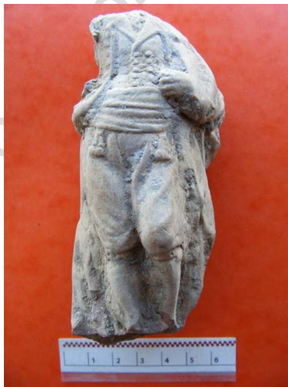
Lám. XII. Representación figurativa en terracota.

Nuestro personaje podría tratarse, dada la vestimenta y el porte, no de un bandolero, sino más bien de un banquero.