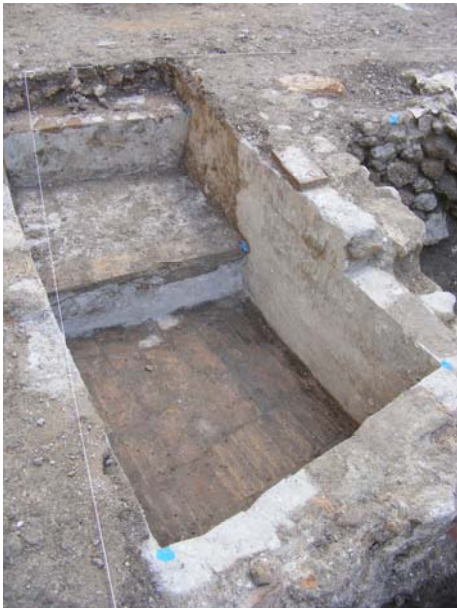
Lám.VII. Pileta contemporánea.

La pileta de reducidas dimensiones apoya y cimenta sobre el geológico, el cual ofrece una suave pendiente homogénea y como veremos, constante hasta el final de la zona excavada.