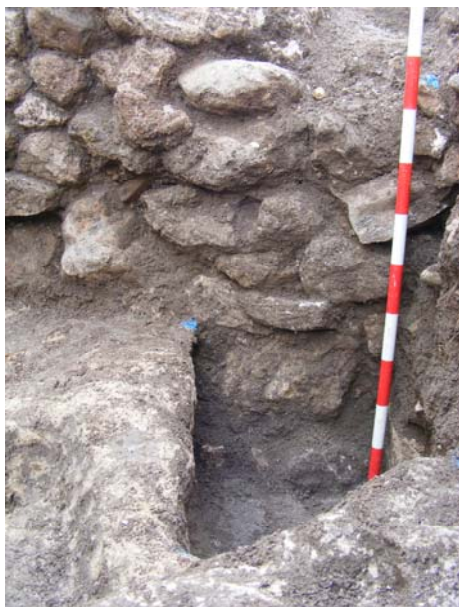
Lám.VI. Estructura sepulcral amortizada.

coetáneas propias de una colmatación sin fin de continuidad hasta la ejecución de la casa.