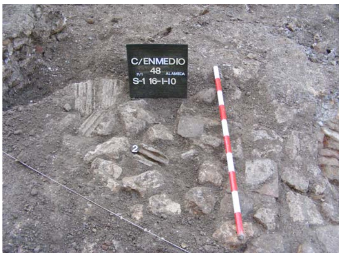
Lám.V. UE.2. Restos constructivos amortizados del s.XIX.

Al retirar la solería encontramos una deposición antrópica consistente en abundancia de material de construcción, como restos de yeso que formaban los forjados de cañizo, los cuales en algunos casos conservan restos de pintura a la almagra.(UE.2).Este estrato ocupa toda la superficie excavada del solar. Una limpieza superficial nos deja al descubierto el empedrado del antiguo patio del que aún se conservan algunos retazos, estando en algunos casos, sobre todo al fondo del solar cubiertos por una capa de cemento, lo cual y como vimos le infiere un uso prolongado. La excavación del sondeo muestra tanto niveles de uso, caso de este pavimento, como estructuras realizadas a posteriori, las cuales consisten en estructuras negativas, como la de una pileta de tres alturas diferenciadas, posiblemente debido a su adaptación al geológico o roca madre, denominado popularmente “arcillón”. La pileta está realizada en ladrillo, revoco de yeso y cemento como aglutinante de la estructura. Su morfología, con características de paredes curvas se debe a una adaptación al espacio. La utilidad de la misma pasa por estar concebida como pileta posiblemente de un molino de época contemporánea, en el s.XX. A nivel superficial encontramos las trazas de cimentaciones realizadas con piedras de medianas dimensiones, sin aglutinante. Las tongadas de nivelación del solar mantienen la inclinación del geológico, observando en ellas diferencias en su matriz, a pesar de ser