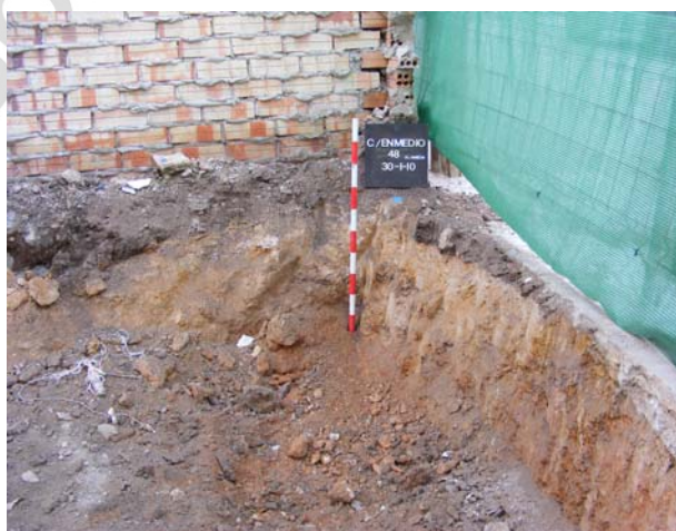
Lám. XI.Excavación en línea de fachada sobre “arcillón”.

El paramento norte presenta las mismas características que el medianero sur. A diferencia de este, encontramos las huellas de lo que debían ser los apoyos para entibar el muro a modo de codales utilizando maderos de sección circular como demuestran las improntas dejadas en el yeso.