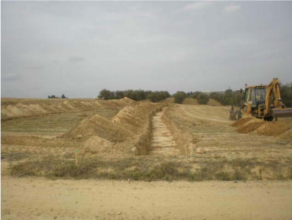
Proceso de realización de las zanjas A, B y C.