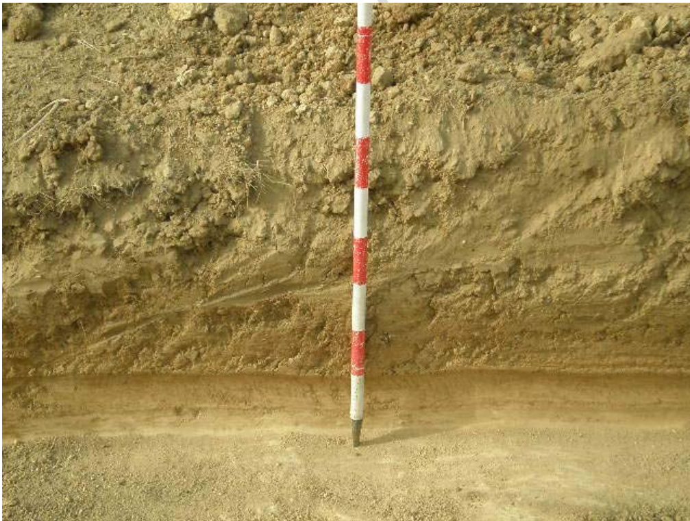
Perfil de una de las zanjas.