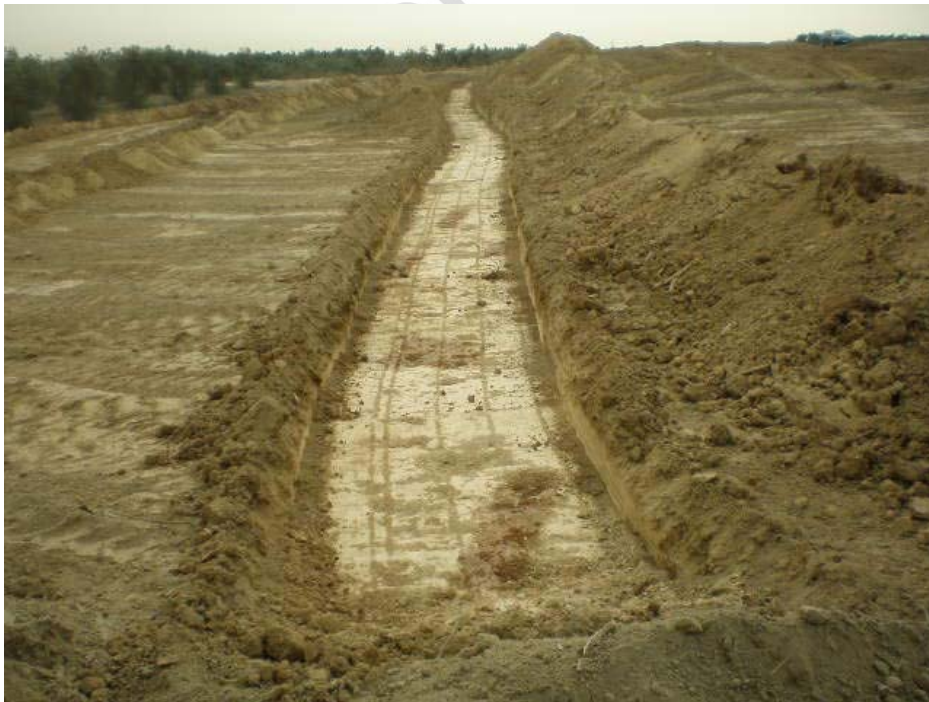
Zanja A desde el Noroeste.

U.E.D.3: Sustrato margoso local, con intrusiones carbonatadas, con coloración amarillenta.