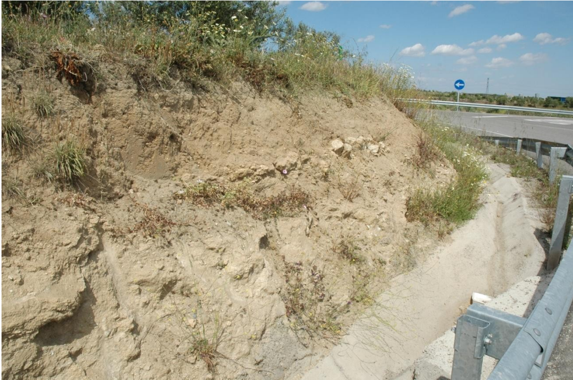
Talud al Sur de la parcela 48. El sustrato vegetal se formó por la aportación de tierras sobre la roca base.