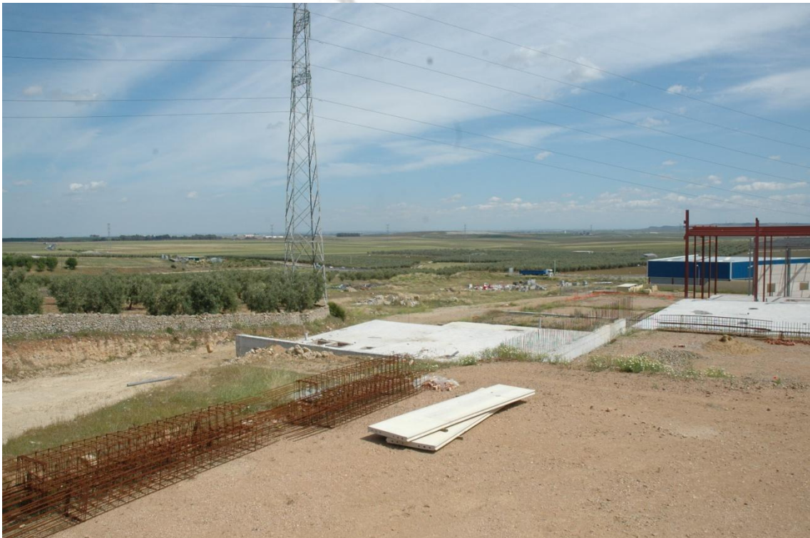
Vista de las parcelas 64, 48 y 49 desde el noroeste