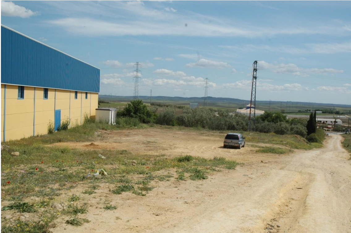
Vista de la parcela 52 desde el Norte