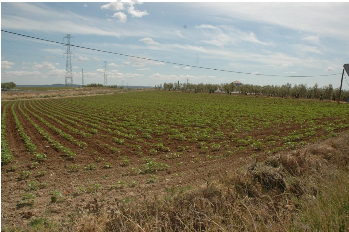
Vista de las parcelas situadas frente al área prospectada, al otro lado de la carretera. Igualmente, se debe a aportes de tierras vegetales, y no presentan restos arqueológicos