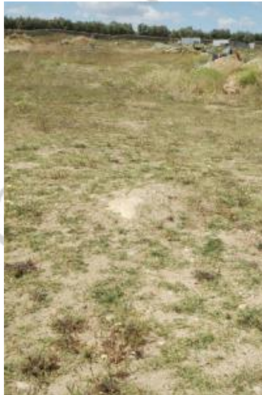
Detalle de los afloramientos rocosos en la parcela 49

- Tras la evaluación visual del terreno podemos constatar la ausencia de restos de cerámica o restos constructivos que nos indicaran la existencia de algún yacimiento arqueológico.