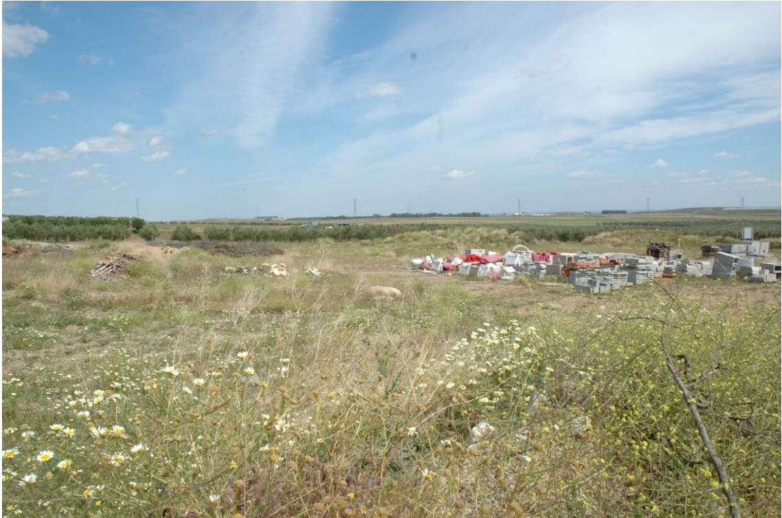
Vista de las parcelas 64, 48 y 49 desde el noreste