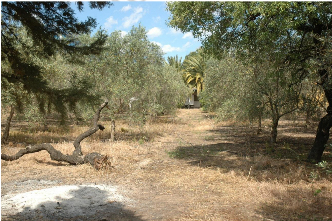
Vista del olivar que ocupa la parcela 52