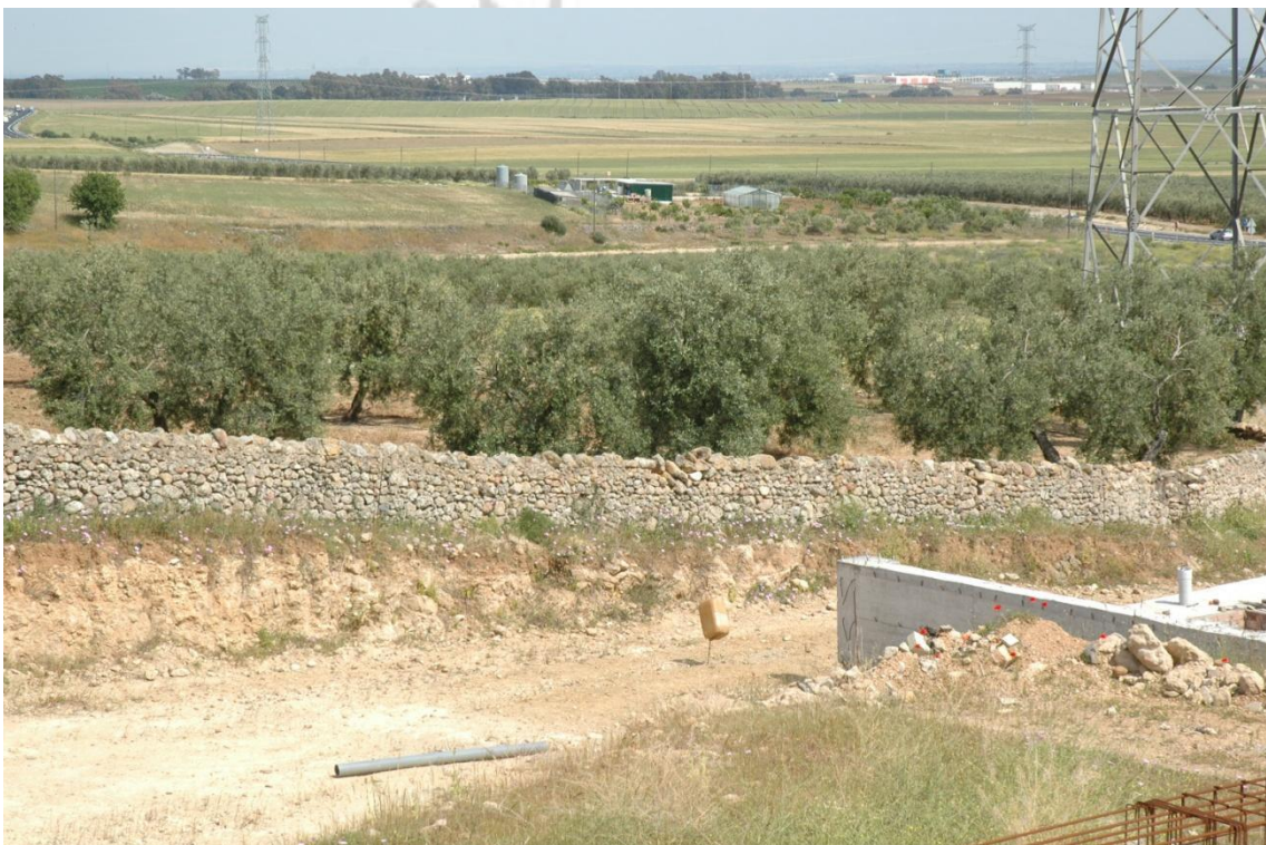
Detalle de un perfil al Norte de la parcela 64