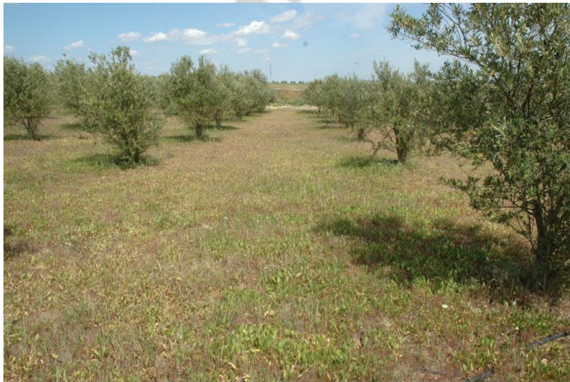
Vista del olivar que ocupa la parcela 48

La puesta en práctica sobre el terreno de la prospección arqueológica ha supuesto un equipo formado por dos prospectores que hemos ido cubriendo la zona en batidas sucesivas manteniendo unas distancias entre sí de 5 m, siguiendo un eje direccional Norte-Sur, hasta completar el reconocimiento del terreno afectado.