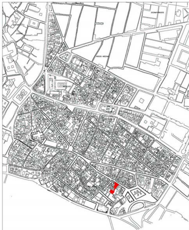
Figura 1.- Localización del solar en Jerez de la Frontera