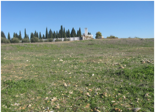
Lámina 7. Vista general con el cementerio al fondo.