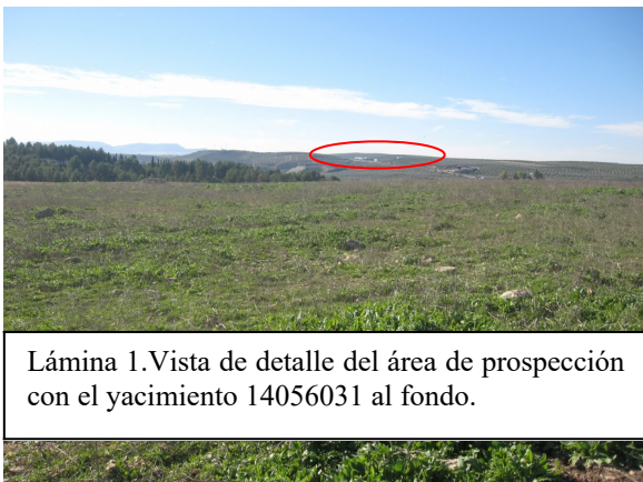
Lámina 1. Vista de detalle del área de prospección con el yacimiento 14056031 al fondo.

La ficha resumida del yacimiento inventariado cercano a los terrenos objeto de calificación urbanística es la siguiente: