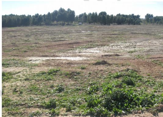
Lámina 8. Límite S. de la parcela, al fondo Parque Forestal Príncipe de Asturias .