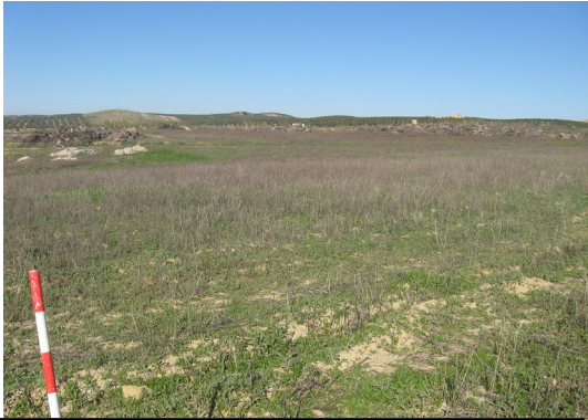
Lámina 5. Plano de la parcela desde el Este.