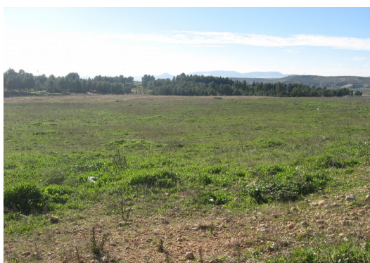
Lámina 4. Plano de la parcela dese el N.