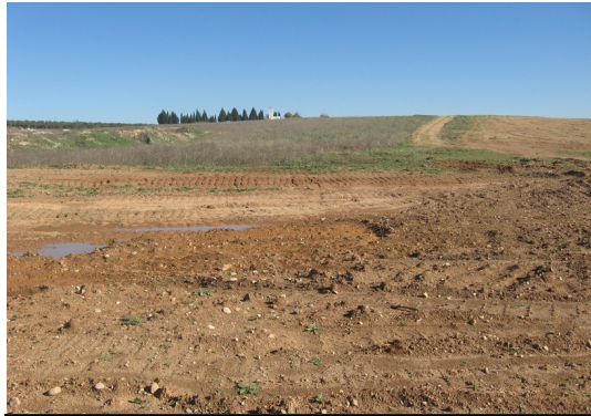
Lámina 6. Panorámica desde el Sur.