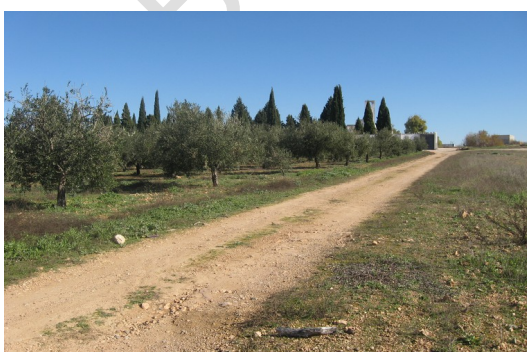
Lámina 3. Camino de servicio desde el O.